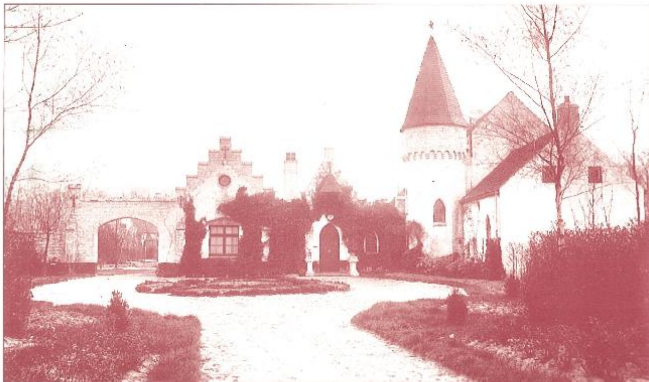
De villa na de verbouwingen