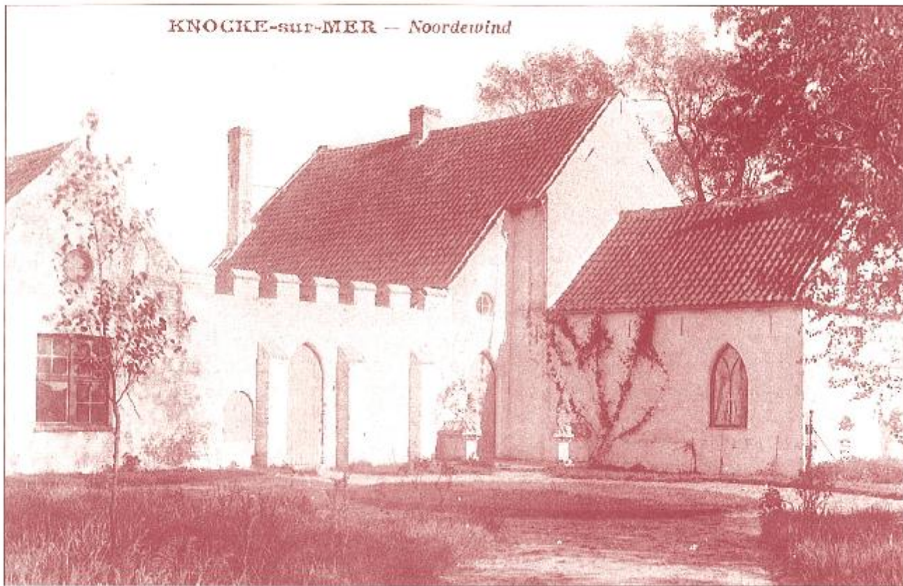
KNOCKE-SUP-MER — Noordewind