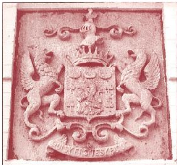
Wapenschild van de familie de Giey

Op de plaat zijn twee schilden afgebeeld : links dit van de familie de Giey, rechts van de familie Parmentier.