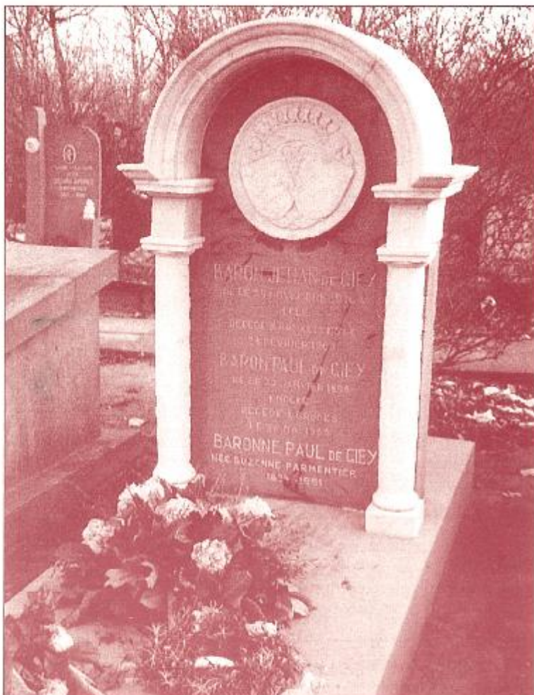
Grafsteen van de familie de Giey op de stedelijke begraafplaats te Brugge.