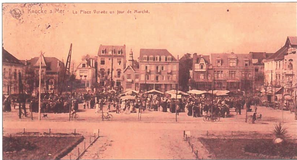
De woensdagmarkt gezien vanop de pui van het gemeentehuis.

berijdbaar en vele kalanten kwamen, in de haast, hun aankopen doen zodat we nog zeer tevreden waren. Het had slechter kunnen zijn. We haalden de honden op en, als we voorbij de plaats reden waar de kar in de gracht was terechtgekomen, zeiden we beiden niets maar hebben hartelijk gelachen. Maar misschien heeft elk toen in zijn eigen gezegd: Van gladde wegen, verlos ons Heer.