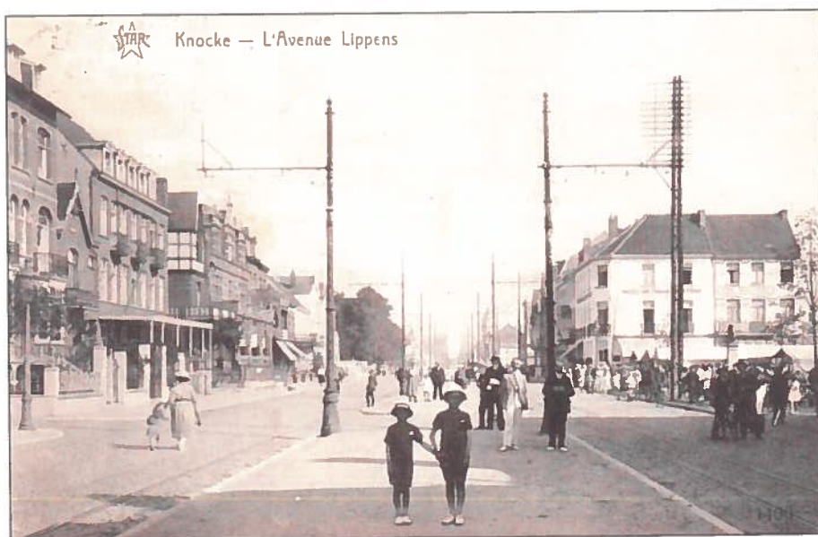
De Lippenslaan ter hoogte van de markt omstreeks 1932-33.

De dag erop reed ik naar Heist en pas aan de voordeur riep ik al: Vader, ge krijgt de complimenten van een madam uit Knokke. Herinnert ge u nog, die altijd kocht toen we stonden aan het standbeeld. Die dame die zo vriendelijk was en schoon gekleed, maar 'k weet haar naam niet. Vader keek op en zei: Dat is nogal grappig, de groeten van iemand die we beiden niet kennen. En de mensen die, dertig jaar geleden bij ons kochten, ze zijn in Knokke nog met honderden.