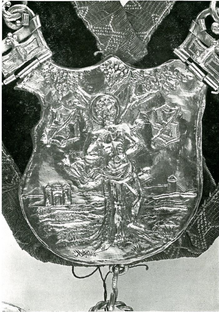
Schild aan de Sireschakel van het Sint-Sebastiaansgilde van Oostkerke