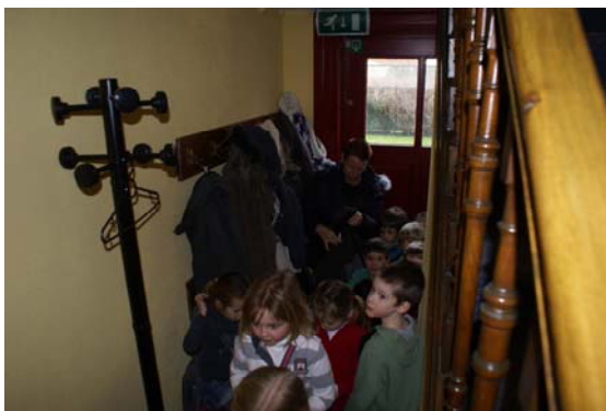
Kapstok naast de trap voorbij de balie verdieping op de hoogzolder

Eerst hangen jullie mooi jullie jaszjes aan de kapstok naast de trap op en dan gaan we stilletjes de trappen op helemaal naar de bovenzolder waar jullie zich als vissertjes zullen verkleden ..