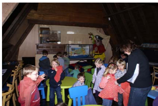
Via de houten trap, op de hoogste