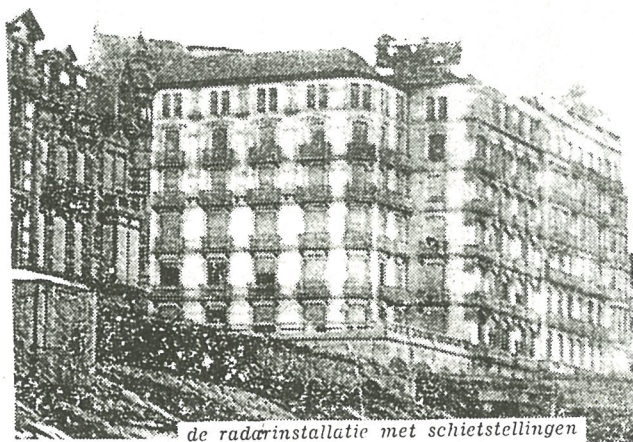
de radarinstallatie met schietstellingen recht over het Grand Hotel.