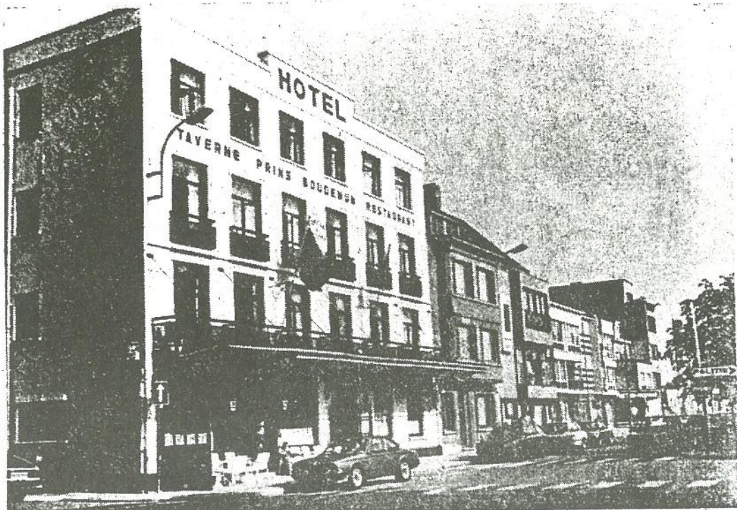
Het hotel Prins Boudewijn, dat dit jaar zijn eeuwfeest zal vieren.