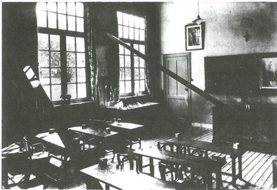
De klas van de kindertuin midden de stutbalken, die na een hevige storm aangebracht werden

koningin, Astrid. De kinderen trokken dan verder, hun instrument onder de arm, om het paleis van de koning te zien. Ze kregen een diner in het Restaurant de la Monnaie. Het was een overgetelike dag geweest. Weken lang spraken ze er nog over. Mr Bossuyt heeft nadien te Brussel, alles kunnen effen klappen.