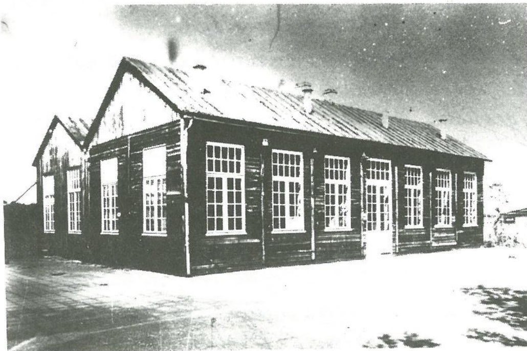
De barak voor de wijk-school van de Oosthoek werd in september 1931 geopend, een souvenir van het IJzerfront