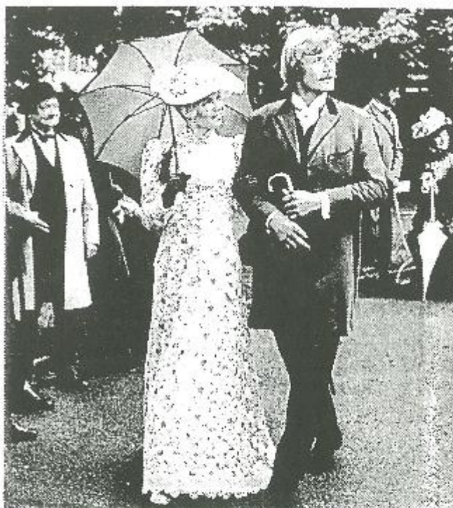
Monique van de Ven in „Keetje Tippel“