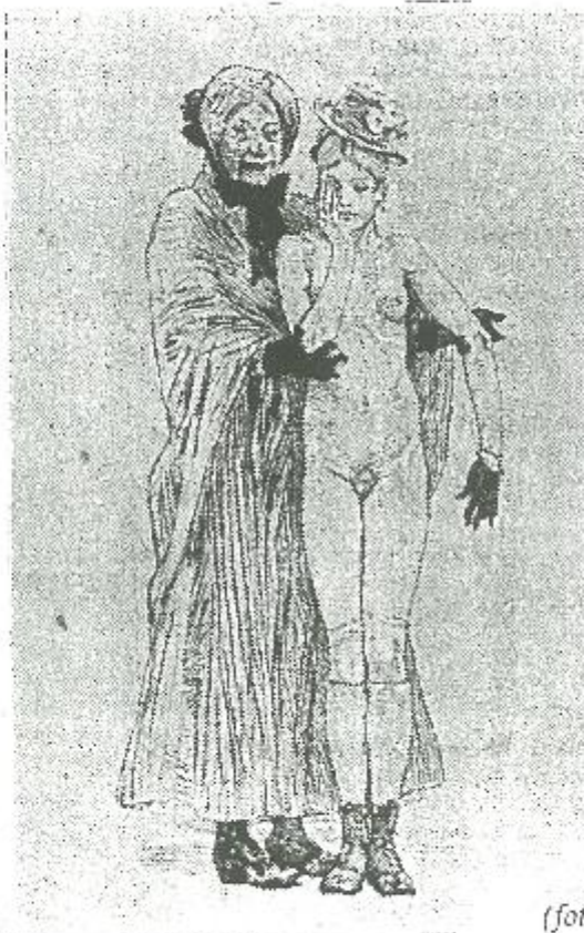
„Ma Fille, Monsieur Cabanel“ van Félicien Rops