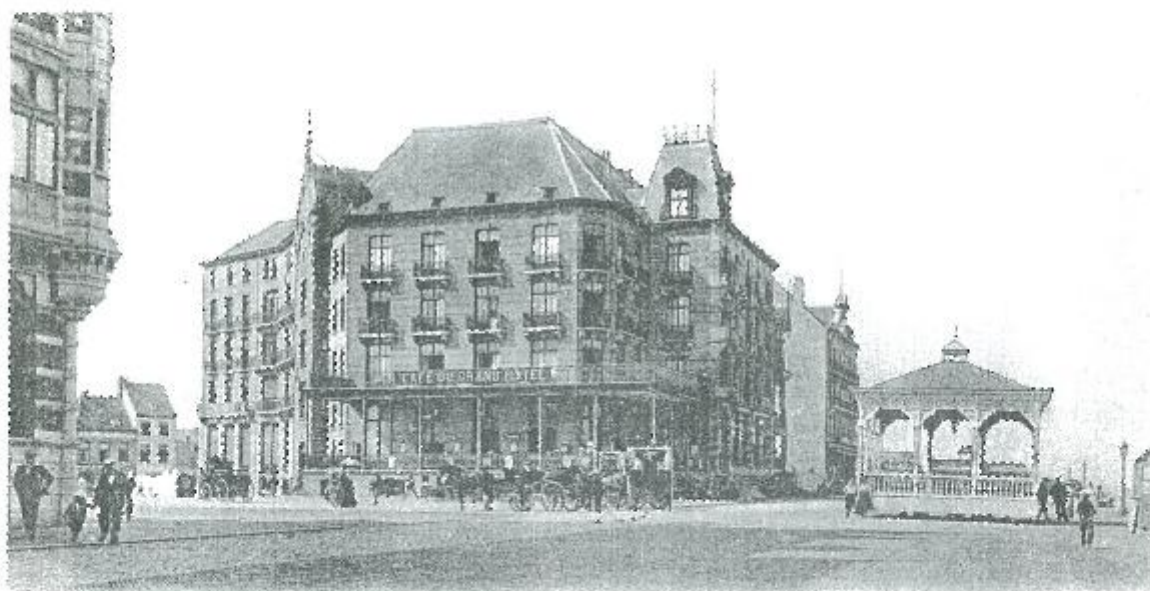
KNOCKE. — Café du Grand Hôtel.

De toestand na de uitbreiding 2e fase, 1905.