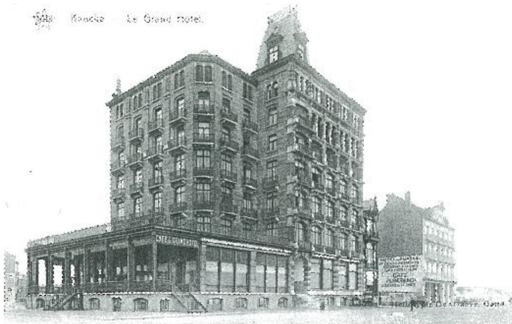
Het hotel na de uitbreiding 3e fase, 1907.