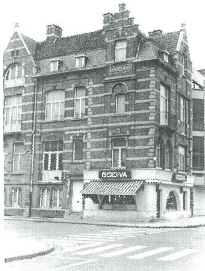
Villa Gabrielle kort voor de afbraak in 1992.