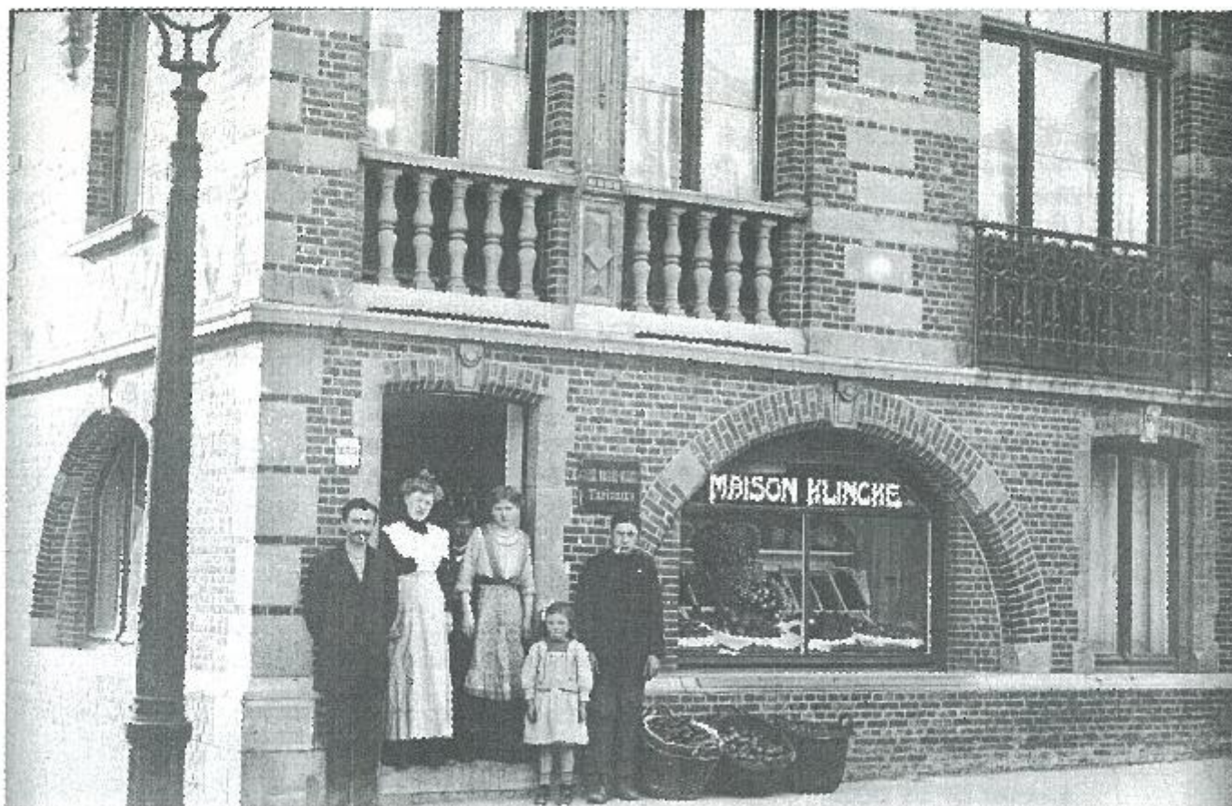
Fier prijkt de familie bij de kruidenierszaak "Maison Klincke". Bij de voordeur hangt een bordje "Hooghe-Klincke Tapissier".