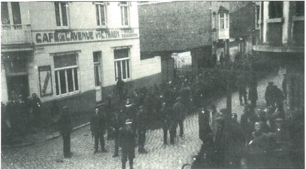
Duitse krijgsgevangenen in de Bouciewijnlaan ter hoogte van de café van Traen.