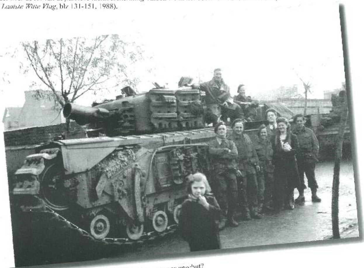
Wie is die kleine meisje gefotografeerd voor het zwaar geschut?