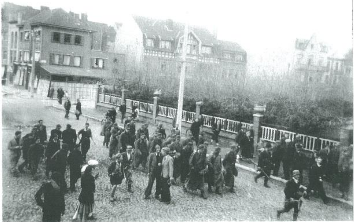
Bij het Verweeplein worden Duitse militairen afgevoerd onder begeleiding van gewapende verzetsstrijders.