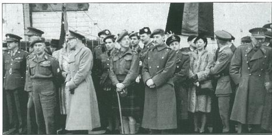
1 november 1945 Inhuldiging van de Canada Square in aanwezigheid van Canadese en Belgische officieren.