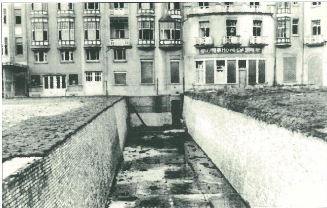
De anti-tankgracht op het Albertplein ; links de Rembrandt en rechts de gevel van het Grand Hôtel du Zandé .