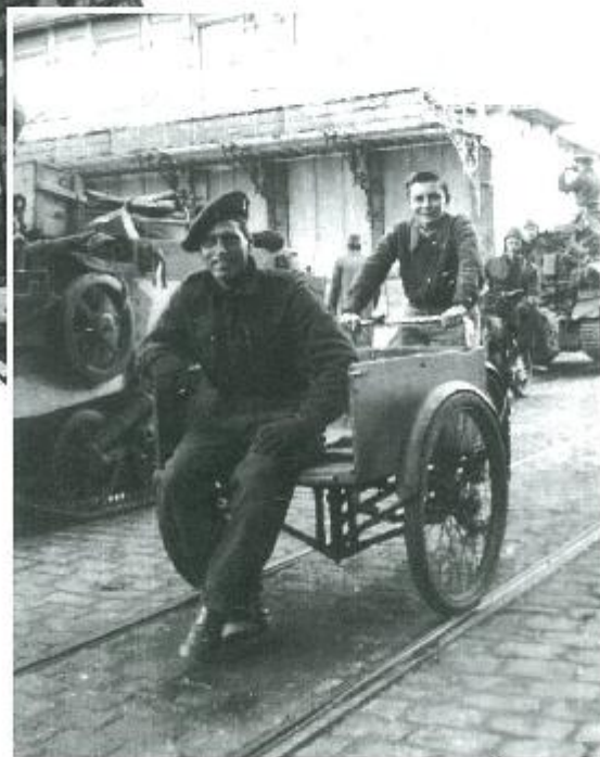
Een Canadees soldaat laat zich fotograferen op een bakfiets bij het Van Bommenplein.