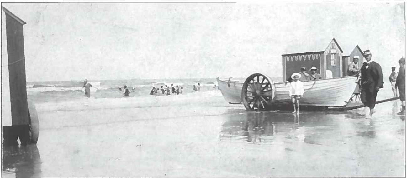
Casimir als bestuurder der baden in 1908 in blote voeten bij de strandcabines.

De gevelrij van de Lippenslaan in de jaren '20. Links pension Lievens bij het vroegere marktplaatsje. De tramhalte bij Café du Tram (Rotsaert), sigarenwinkel van Verhelst, Ijzerwaren Valcke, Café la Victoire, Pension Haegeman, (later Hotel Café des Sports), Au Rapide, schoenhandel van Roose, bakkerij Waegenaere-Tanghe, Pension de la Poste, Jan Desmidt, postgebouw.