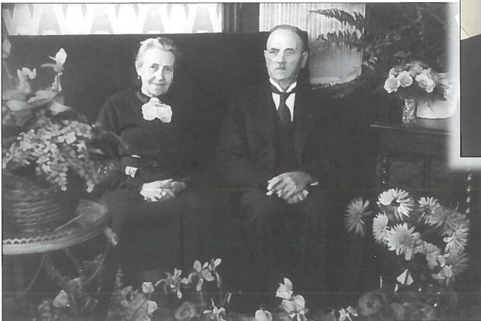
Het echtpaar op hun gouden jubileum in 1945.