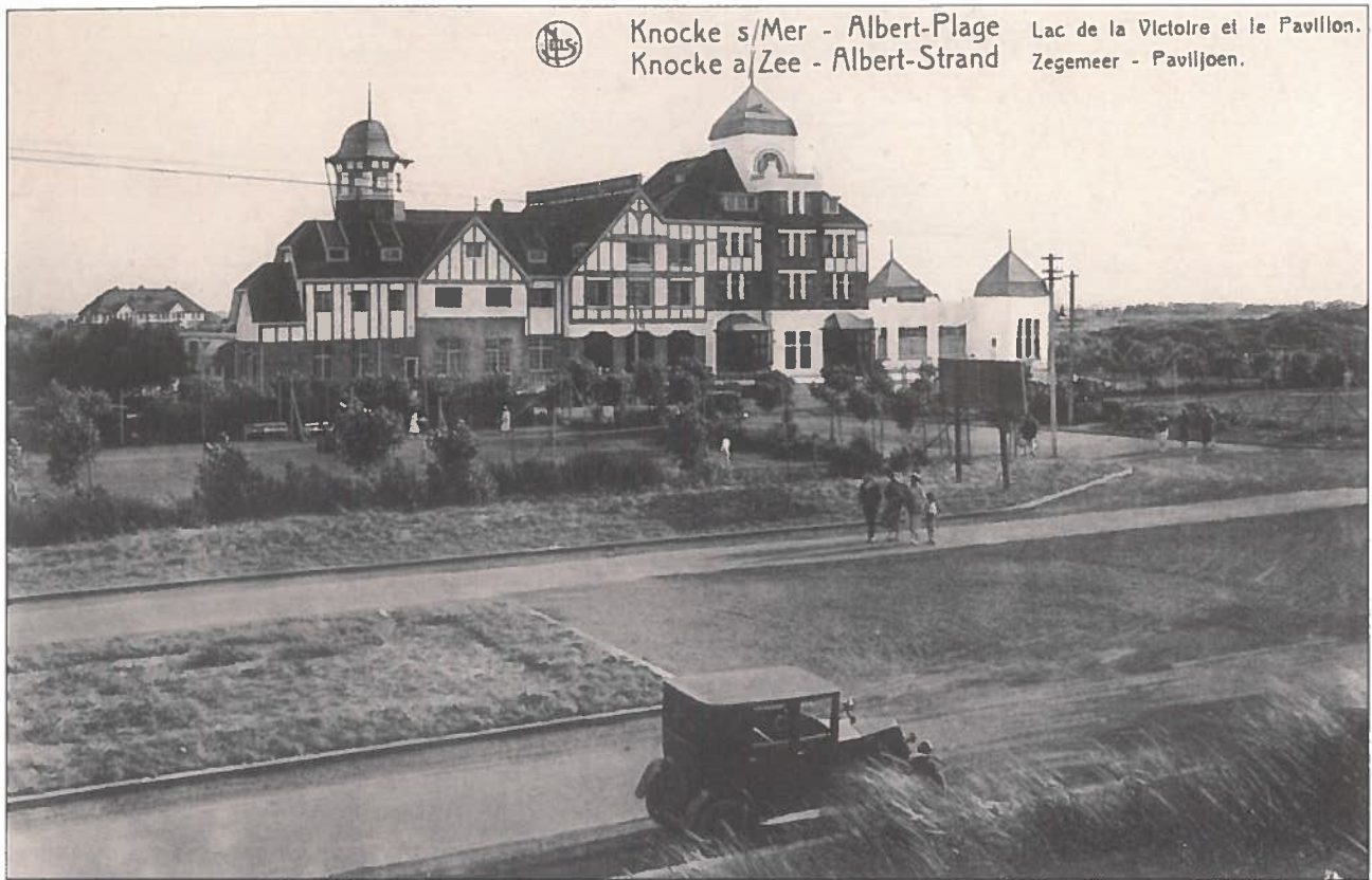
'Pavillon du Lac' uit 1926, gezien vanaf de Koninklijkelaan (nu de Elizabetlaan).