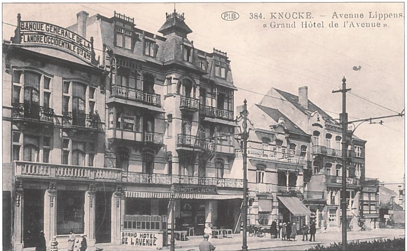
(PIB) 384. KNOCKE. — Avenue Lippens « Grand Hôtel de l'Avenue ».

Vóór 1913 werd dit mooie hotel gebouwd dat verschillende benamingen kreeg: 'Germania', 'L'Avenue' en 'St. Moritz'. In de jaren '50 werd het omgebouwd tot appartementen, links een bankinstelling met 'sombere' gevel. Op de benedenverdieping kwam de elektrozaak Morbee en de boekhandel van Mevr. De Schrijver, later Foto Jones; nu vinden we er 'Van den Borre'.