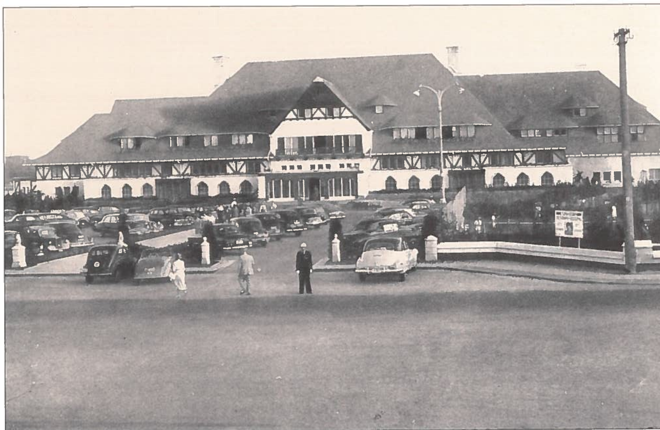
In 1948 werd het 'Pavillon' omgebouwd tot hotel 'La Réserve'. In 1976 kwam er aanpalend het thalassocentrum. Ondertussen werd 'La Réserve' in 2009 gesloopt voor een nieuwbouw in hedendaagse architectuur.