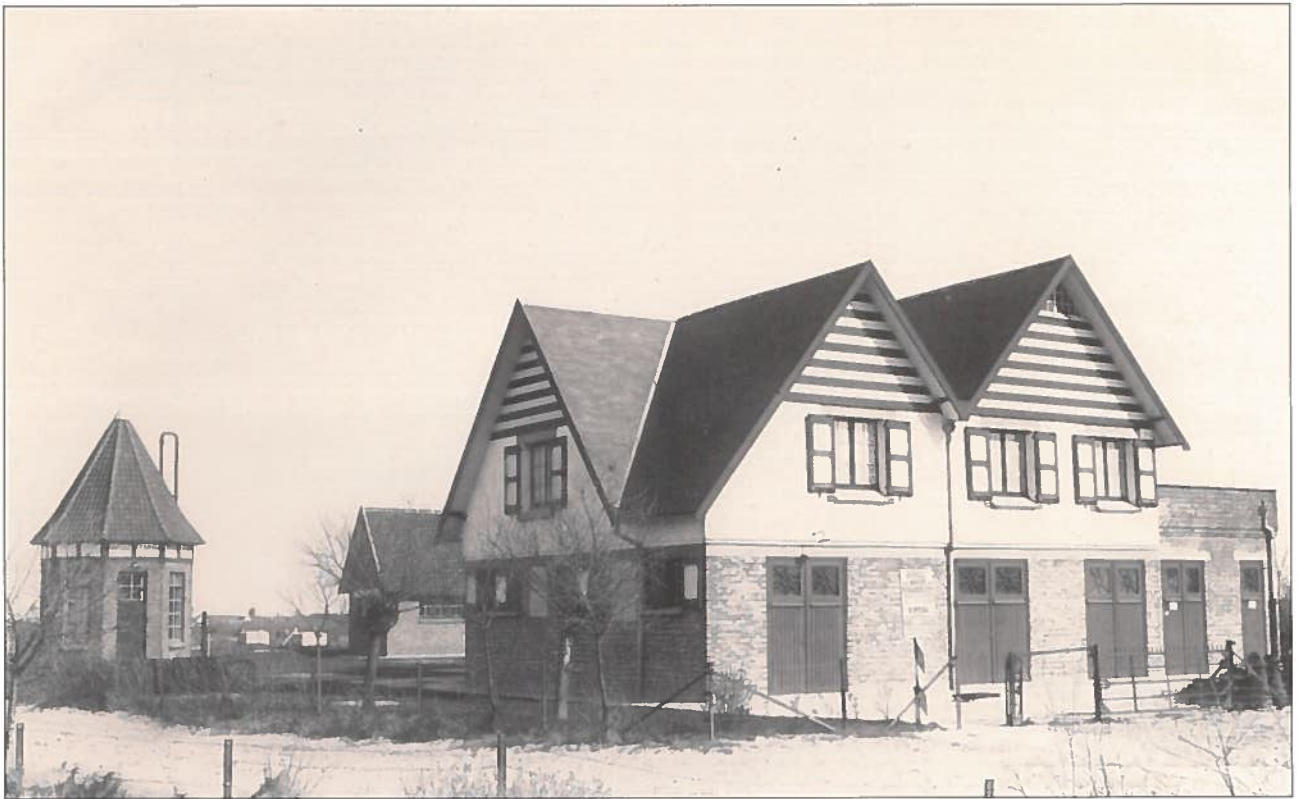
Het Waterkasteel uit 1926 langs de Helmweg, gebouwd door de Cie. Het Zoute en overgenomen door de gemeente. Na een brand enkele jaren terug, wacht het op een grondige renovatie!