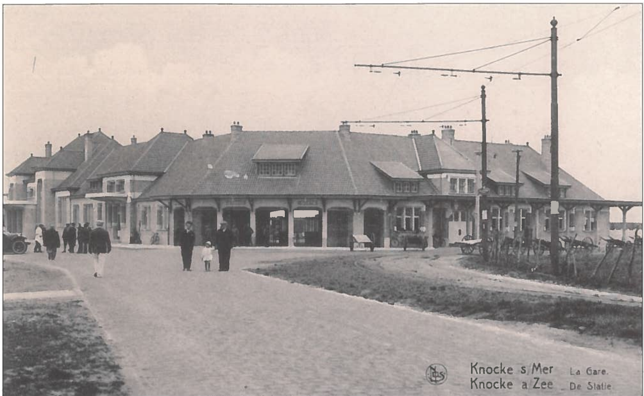
Zicht van het treinstation vanuit het noorden. Het bijgebouw van het oude station waar de stationschef woonde is nu gerenoveerd tot Italiaans restaurant.