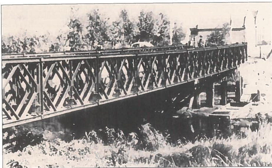
De Baileybrug te Retranchement.

Copy of the letter sent by Jack's Major to his parents. /