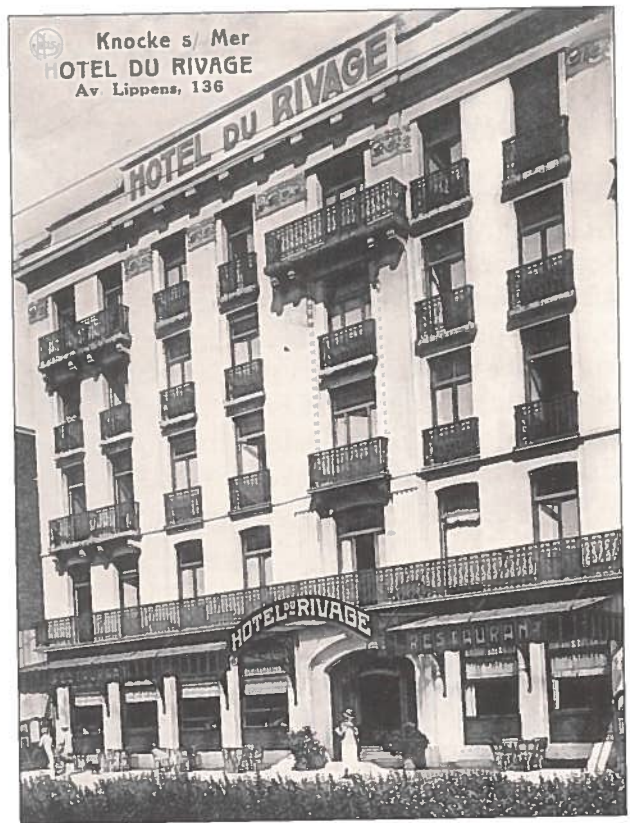
Hotel du Rivage.