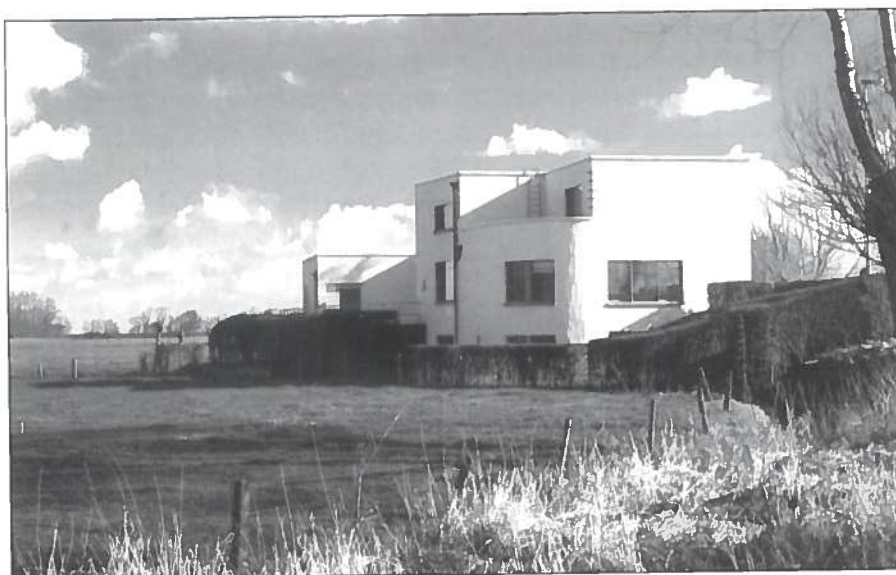
Vijfringen' langs de Graaf Jansdijk.