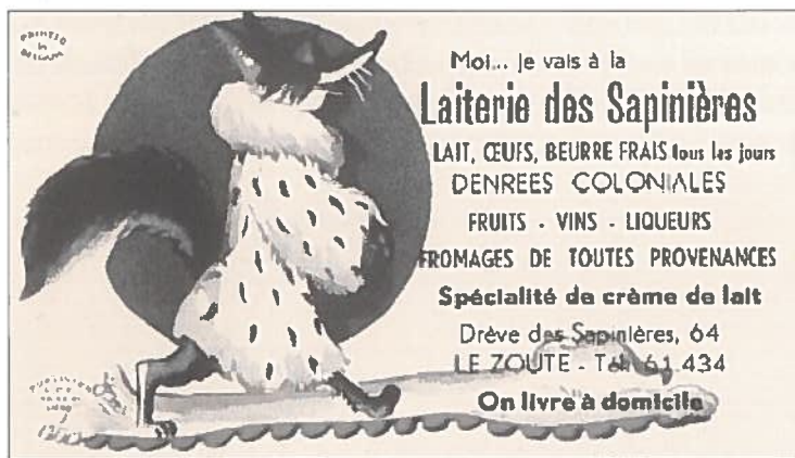
Eerste publiciteit in... het Frans.

In de twee maanden van het seizoen hadden we 2 personen, studenten en of leerlingen, die hielpen in de winkel. Een jongen om met de boodschappen rond te rijden, en een meisje om te helpen in de winkel. Ook enkele nichtjes zijn komen helpen zoals Mia Vroom (1 maand) en Veerle Magerman (2 maanden).