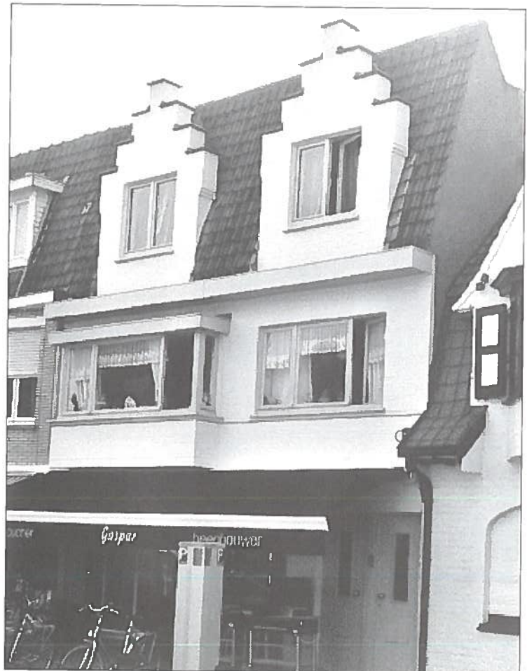
Winkel Sparrendreef 86 anno 2006.

Vervolgens is er de beenhouwerij Gaspar gekomen die er nog steeds inzit. Zij hebben serieuze veranderingen gedaan in de winkel en in 2006 de gevel geschilderd. Zij hebben twee kinderen, een dochter die een jaar in Amerika heeft gestudeerd en nu stewardess op cruiseschepen is en een zoon die muziek-academie volgt in Leuven.