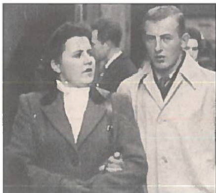
Bezoek Brussel (4 november 1945).

Dit eerste verblijf in Knokke duurde een maand en in de zomermaand augustus hebben we nog een keer een maand in dezelfde villa verbleven, want mijnheer Vastapane had deze gehuurd voor een heel jaar.