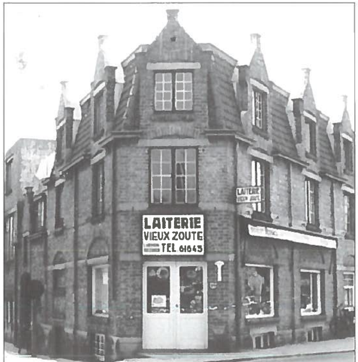
Laiterie 'Vieux Zoute' in de Emile Verhaerenlaan.

In het najaar van 1948 zijn we dan als zelfstandigen begonnen met "Laiterie Vieux Zoute" in de Emile Verhaerenlaan. Wat nu bakkerij 'Blé d'Or' is. Dit was een melkhandel en kruidenierswinkelje.