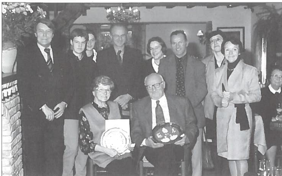
De familie met de twee schepenen.