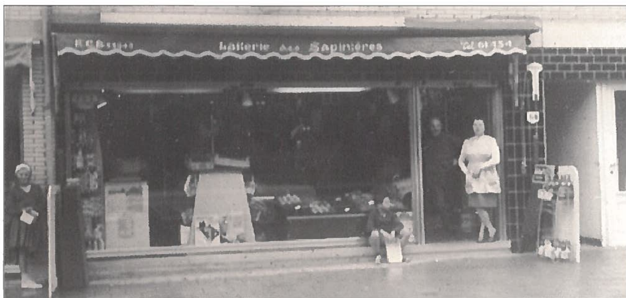
Laiterie des Sapinières.