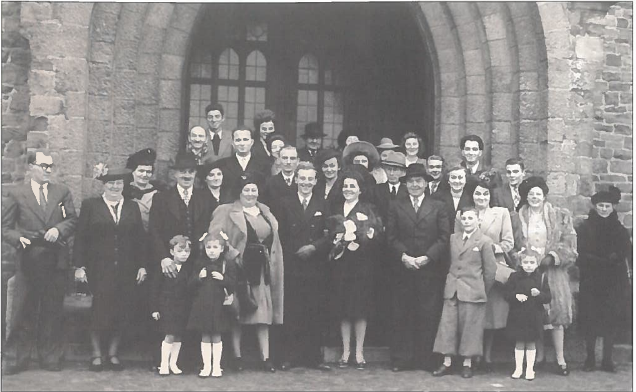
Familiefoto genomen na de huwelijksmis.

- 'Rabouillière': hier heb ik twee jaar gewerkt in 1948 en 1949. De eigenaar was een dokter die af en