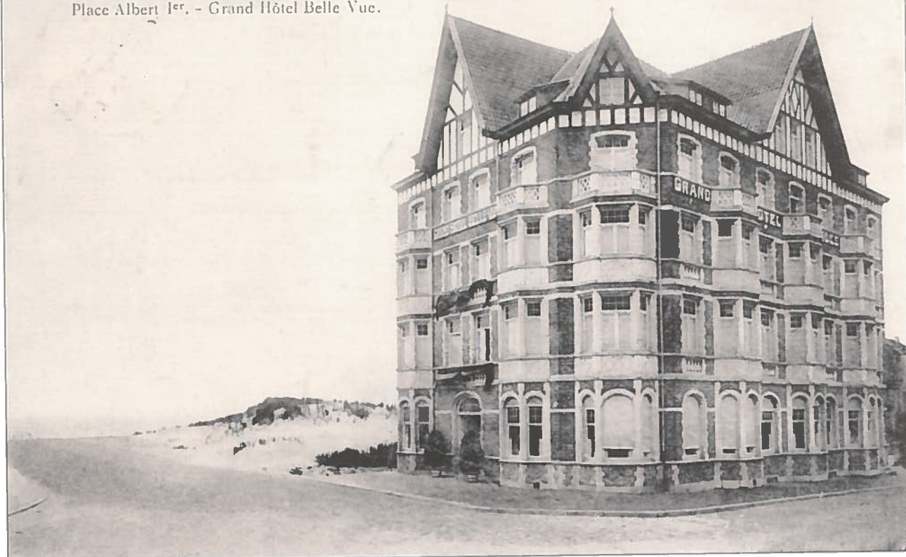
Op de noordoosthoek van het Albertplein en de Kustlaan kwam in 1913 het 'Grand Hôtel Belle Vue'. Deze mooie façade verdween in 1976 uit het straatbeeld van het Zoute.