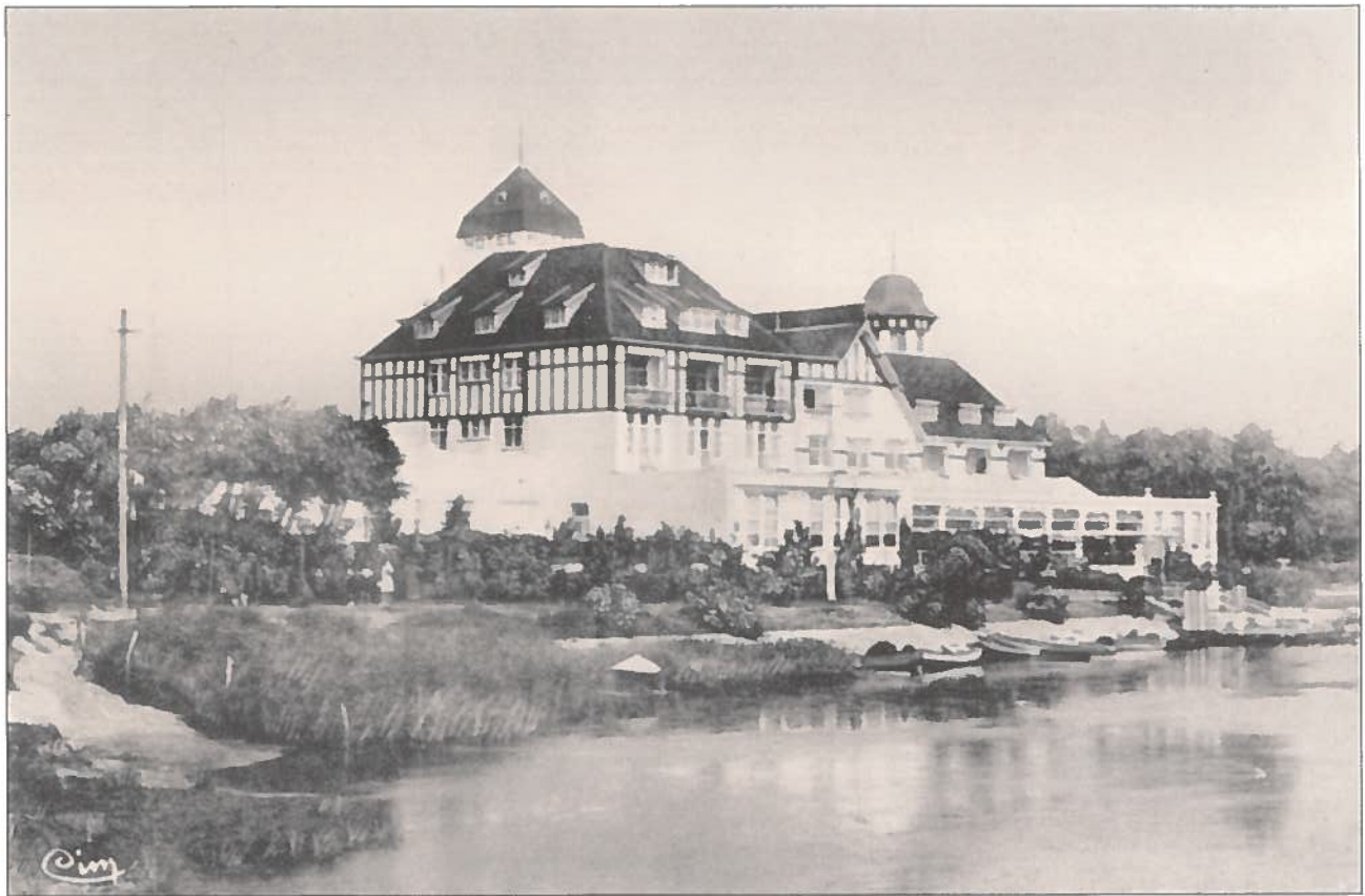
Het 'Pavillon du Lac' uit 1926, omgevormd in 1948 tot 'Hôtel La Réserve', uitgebreid in 1976 met een thalassacentrum en gesloopt in 2009 voor een nieuw hotel in hedendaagse architectuur.