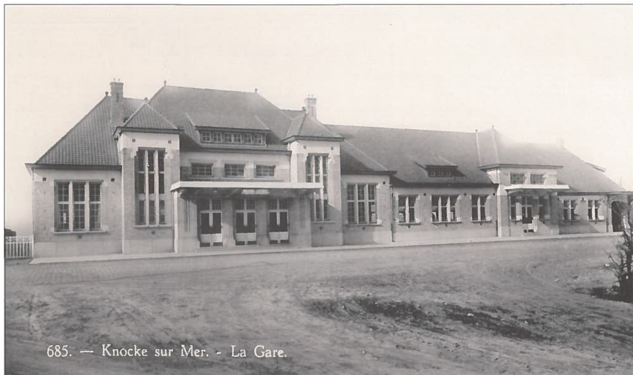
685. — Knocke sur Mer. - La Gare.