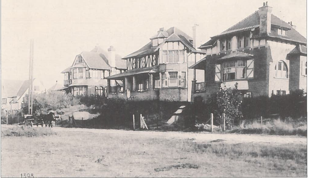
De villa's langs de 'Chemin Gallois' (Welspad) stonden op een duinketen (met zicht op de mini-golf). De Anglo-Normandische stijl was toen kenmerkend aan onze kust. (Prins Filiplaan).