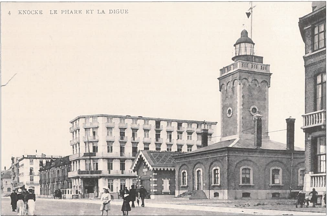
De vuurtoren uit 1872 werd in 1952 gesloopt en vervangen door een toerismekantoor, ondertussen ook verdwenen voor een replica van de lichttoren.