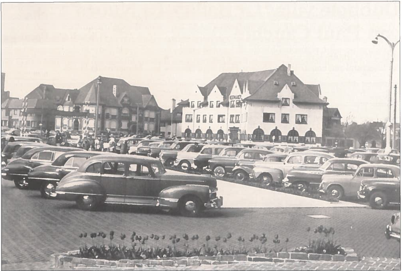
Het 'Normandy Hotel' uit 1932 op de Canada square gezien vanaf de parking van 'La Réserve'.