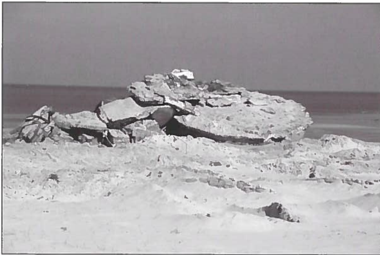
Helaas moest ook deze geschutsstand eraan geloven. Op de foto werd de constructie verplaatst en omgekieperd en alle stukken samen gestapeld om afgevoerd te worden.

Vernielde betonnen constructies achter de R612 in 1968. In het midden van foto steken in de Zvingeul brokstukken uit. Dit zijn de resten van een antitankversperring die dwars door de Zvingeul zich uitstreckte tot op Nederlandse bodem. De versperring was opgetrokken met stalen profielen en Tsjechische egels, die vastgemaakt waren in een betonnen plaat.