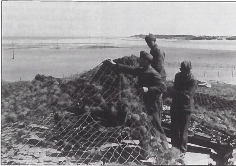
Dezelfde opstelling tijdens de oorlog, met boven het hoofd van de middelste soldaat het gekende Noordzeehotel van Piet Faas.