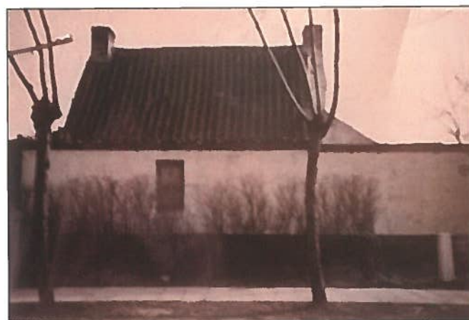
Noordgevel met uitbouw van de woning Boey, gesloopt in 1963 (nr. 6).