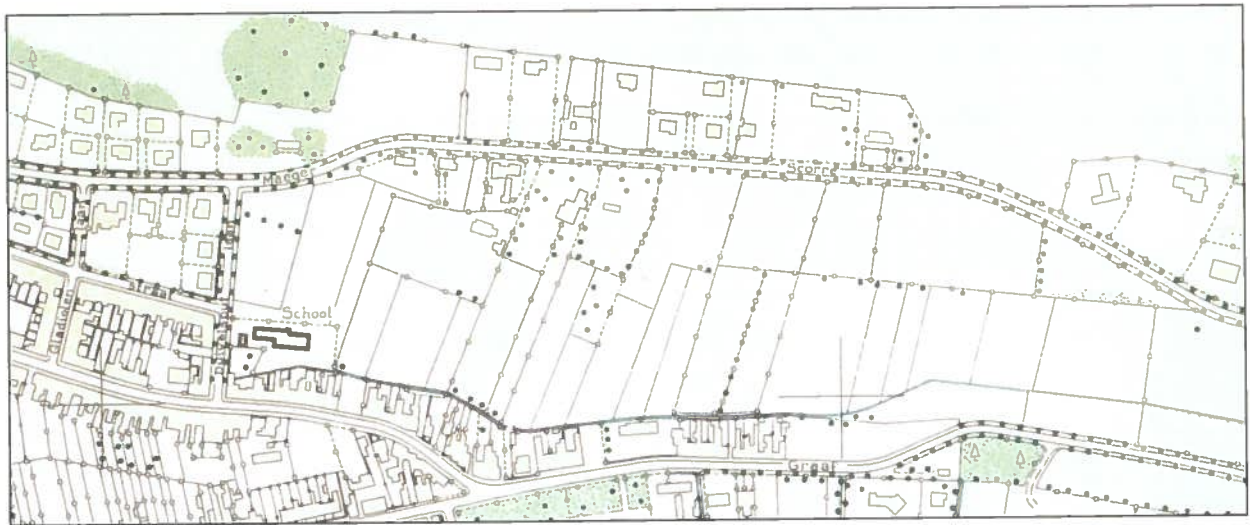
Kaart uit halfweg de jaren '60