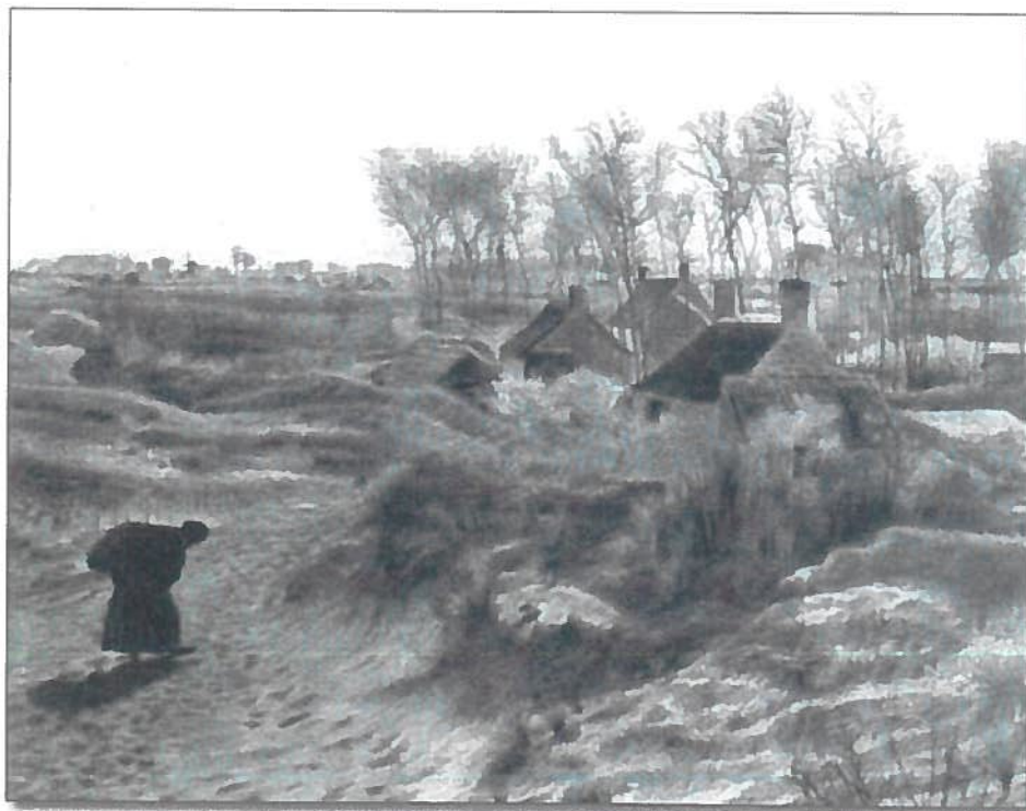
Huisjes in de Maeger Schorre, K. Mediz, 1889-90.

Nr. 563, eigenaar Prins Gustaaf De Croy, (gesloopt omstreeks 1870; stond 300 m. oostwaarts van de kernzone).