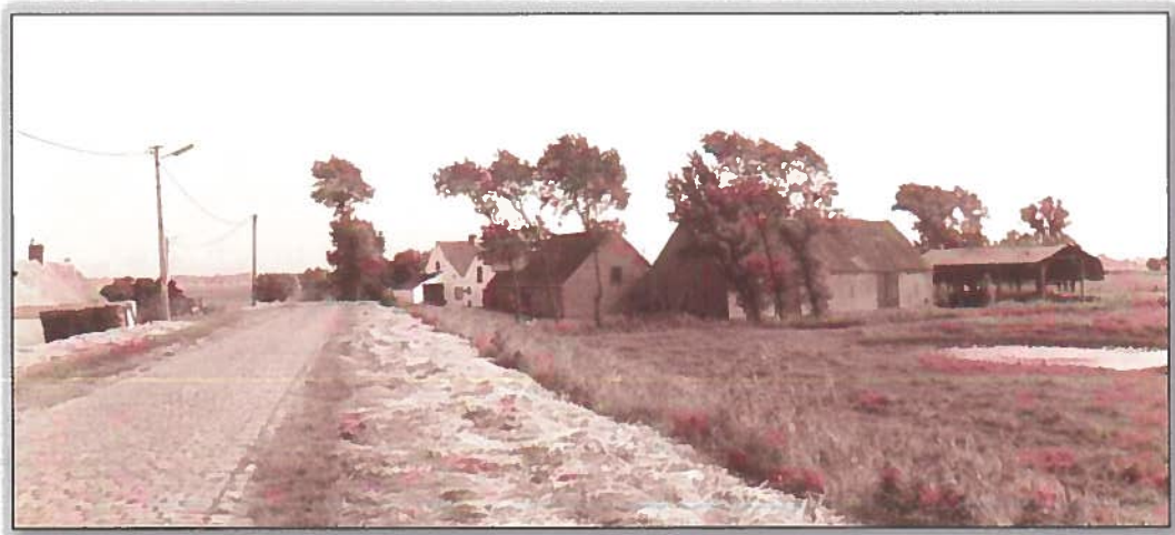
'Wittehoeve' langs de Graaf Jansdijk, gefotografeerd in de jaren '70

1866 Verkozen tot schepen. Hij stelde zich actief op in de gemeenteraad met bijzondere belangstelling voor het onderwijs.