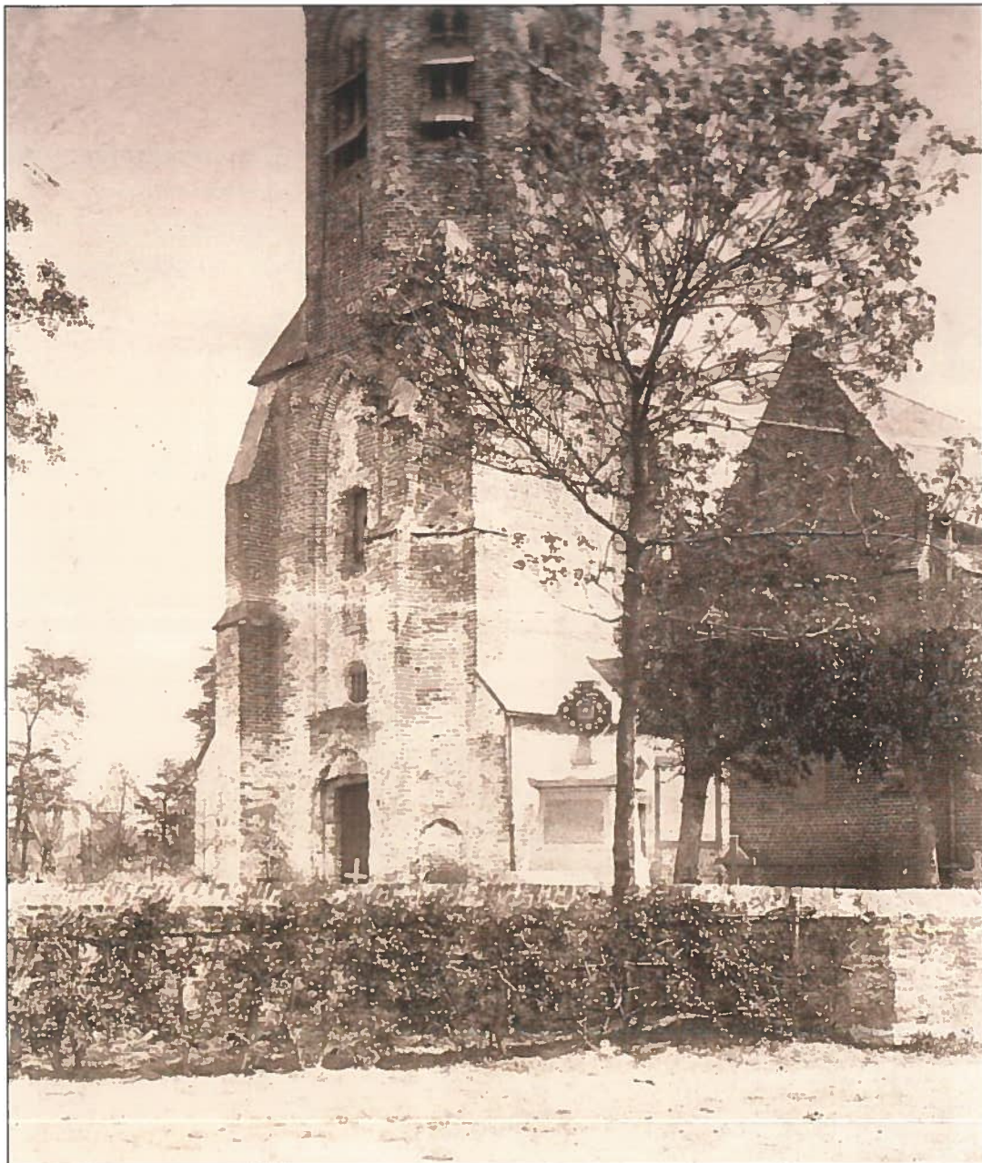
Het grafmonument op het kerkhof bij de Margaretakerk.

De straat waar hij zijn laatste levensjaar doorbracht, kreeg de naam 'Sebastiaan Nachtegaelestraat'.