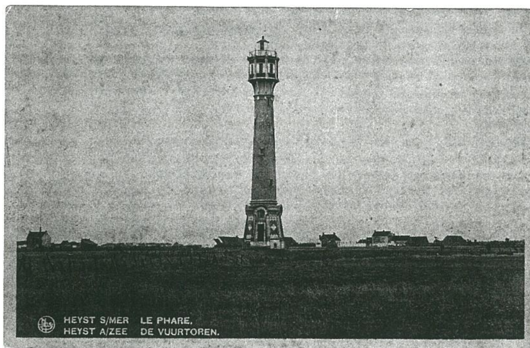
HEYST S/MER LE PHARE, HEYST A/ZEE DE VUURTOREN.

Wel bezit auteur van dit artikel een militaire topografische kaart van Heist en omgeving van 1889, maar heruitgegeven in 1894, waarop deze vuurbaak nog aangeduid staat als " Feu des Pecheurs ". Deze " vaste Phare " verdween in ieder geval tussen de jaren 1890 - 1898. Waarschijnlijk werd de taak overgenomen door de vuurtoren die in 1897 op het einde van de havendam van Zeebrugge werd gebouwd.