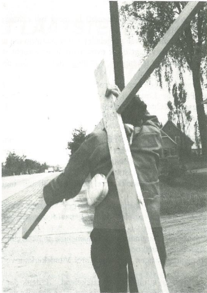
Het kruis van Vic