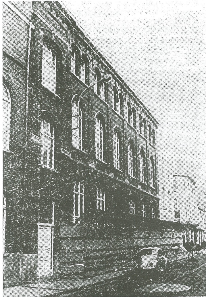
Vele moeders en meisjes van Heist zullen zich dit gebouw herinneren als het pensionaat, met zijn droevige en blijde dagen. Het zullen herinneringen blijven daar de slopershamer reeds in werking is getreden. (dh)