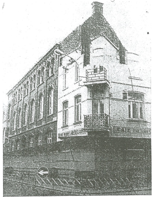
Veel moeders en meisjes zullen zich dit gebouw wel herinneren als pensionaat. Het zullen voortaan louter herinneringen blijven, want strukt men met de slopershamer aan.

Met het Vernieuwd Secundair Onderwijs stelden zich voor de scholen heel wat problemen, vooral de klaslokalen vormden 't knelpunt. Ook de Vrije Meisjesschool in de Kursaalsstraat te Heist had behoefte aan lokalen die aangepast en modern genoeg waren voor het hedendaags onderwijs.