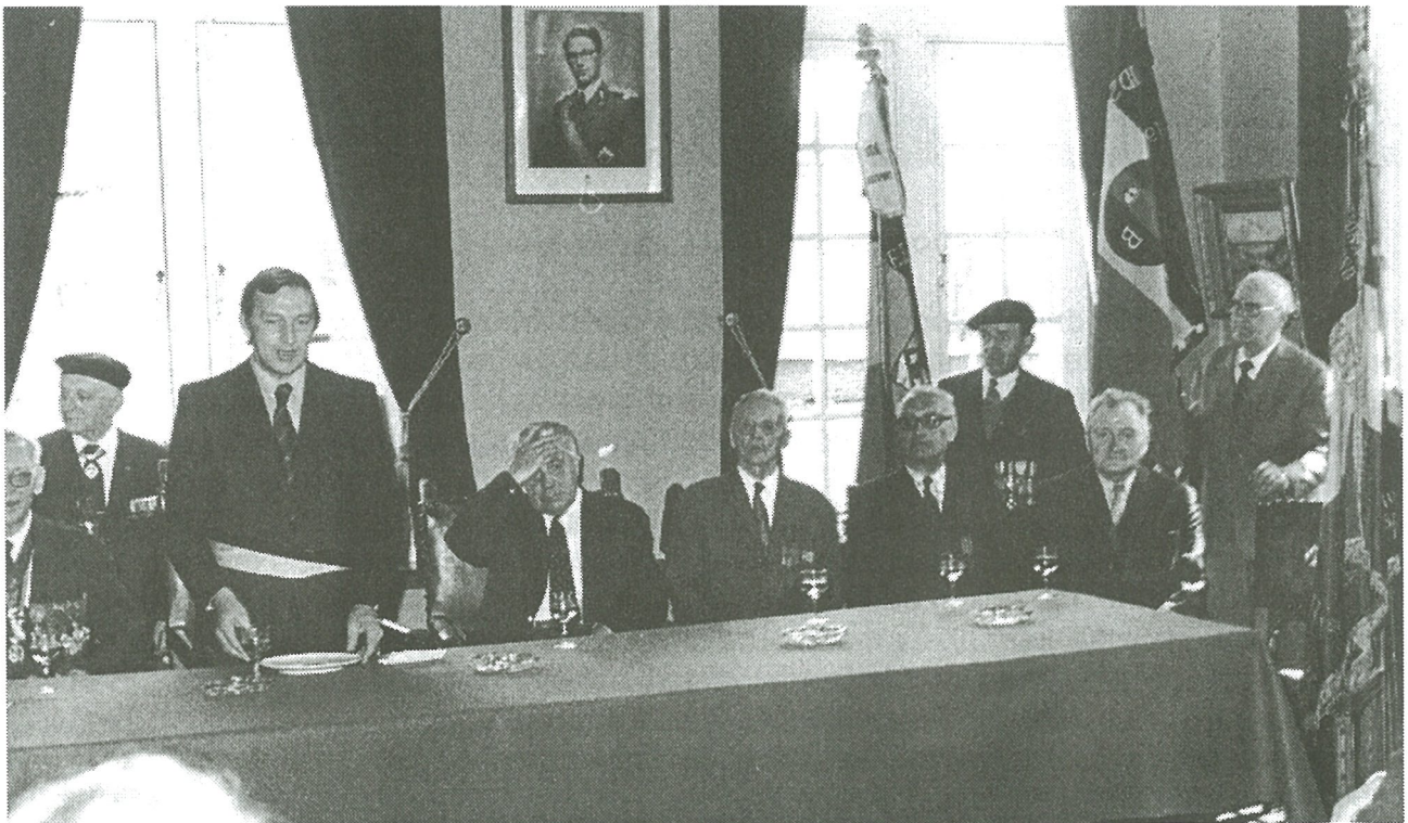
Ontvangst oudstrijders op het stadhuis