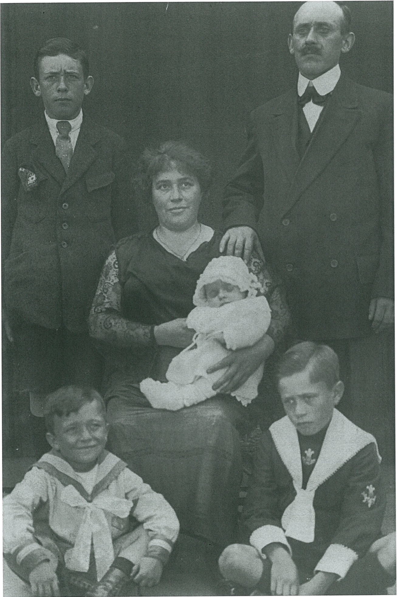
HEYST LEEFT 2