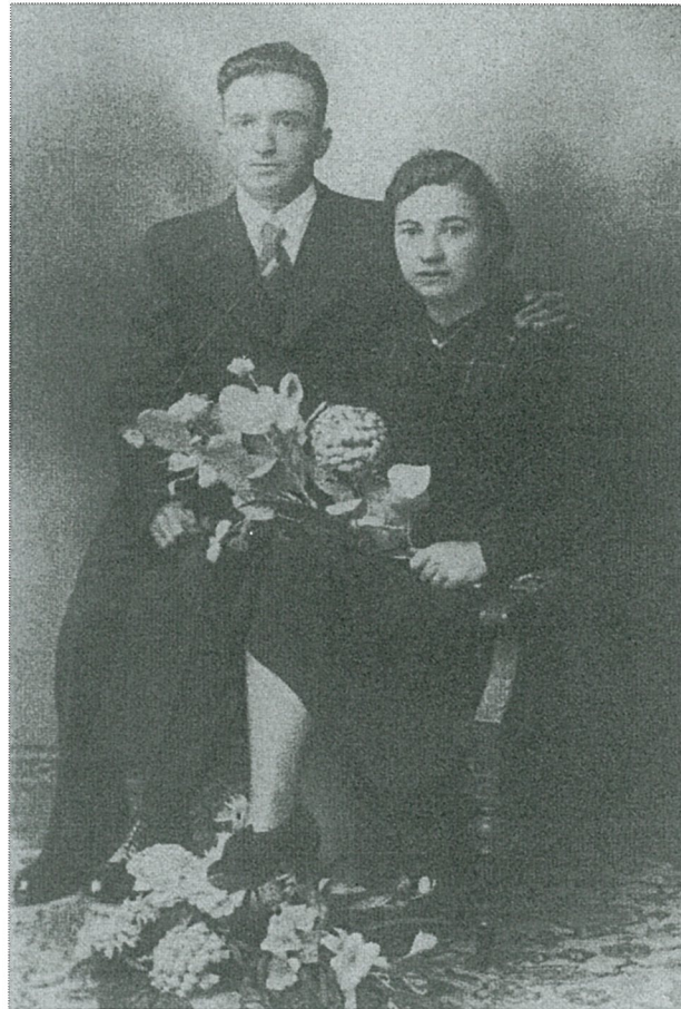
Trouwfoto naar aanleiding van hun jubileum

In 1953 vestigde het gezin zich in de huidige woning in de Guido Gezellestraat.