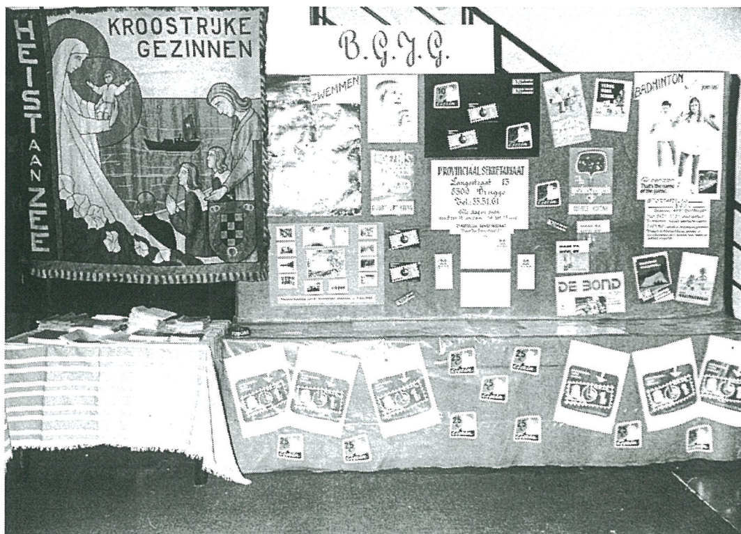
Parochierama Ravelingen 6 – 7 juni 1976