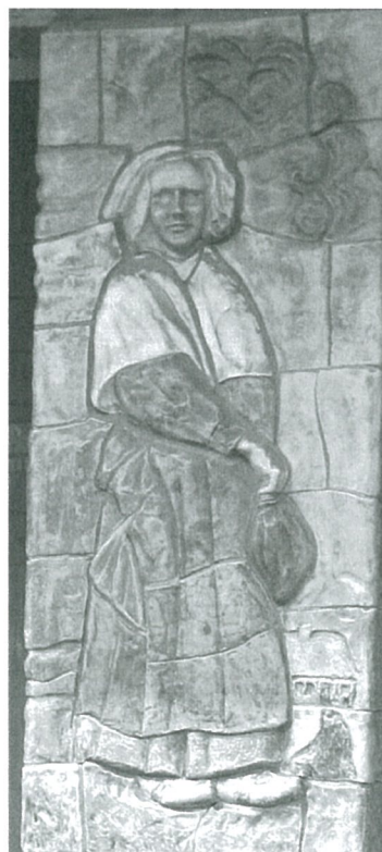
De bedreigde gevelversieringen