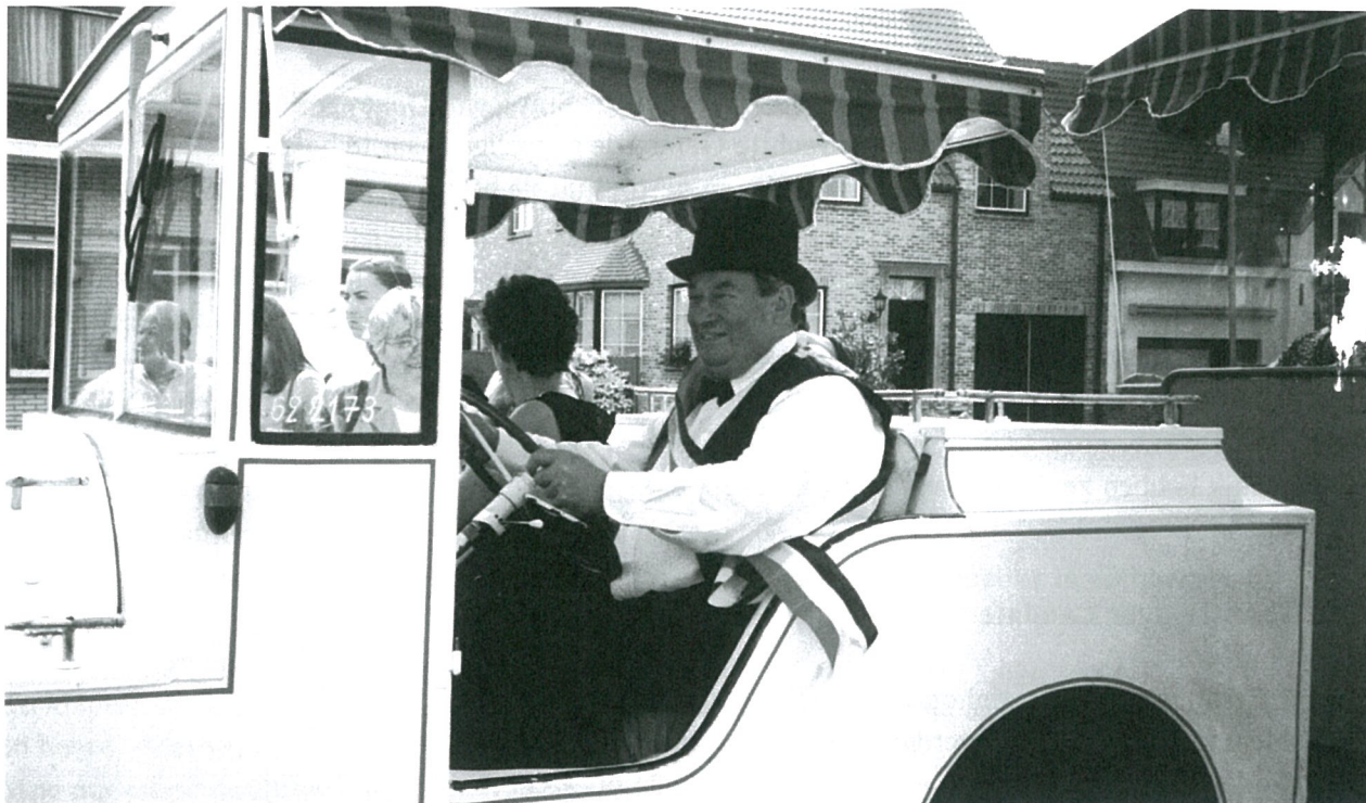
En ook wijkburgemeester te Ramskapelle ...

En zo is het met alles hetzelfde: Eind goed, al goed !