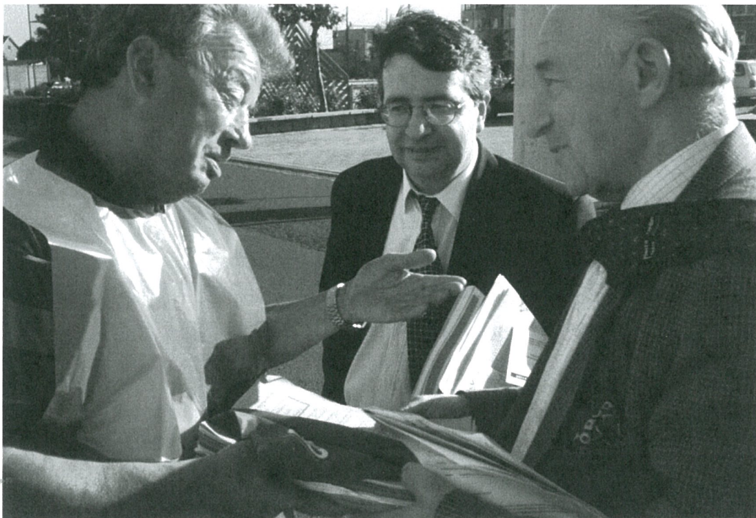
Petitie-actie tegen de milieubelasting (stadhuis Heist)