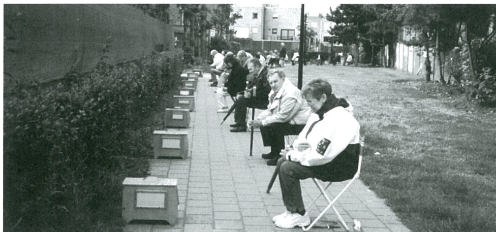
Vinkenzetting naast museum Sincfala