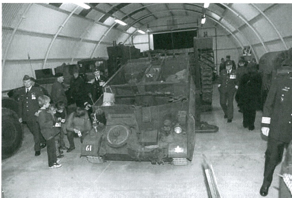
Rupstransport voor 30 personen nu ondergebracht in een van de hangars

Een dossier werd opgemaakt. Het gemeentebestuur en de vzw Bezoekerscentrum Bevrijding kwamen tot een samenwerkingsakkoord en op basis van deze gegevens kon de gemeenteraad opdracht geven om een ontwerp te laten maken met gedetailleerd bestek.