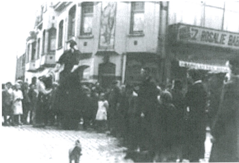
Pier ter hoogte van "Ludders" 1938 (G. Devent)

De namen zijn nogal evident want Johanna (in de volksmond Wanne) en Petrus of Pieter (in de volksmond Pier) waren zeer gebruikelijke namen in die tijd.