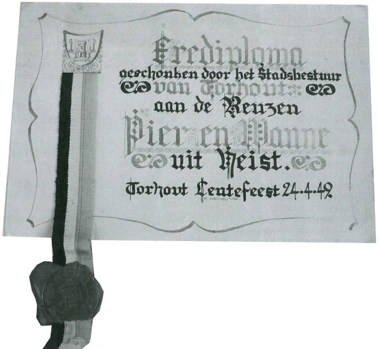
Erediploma geschonken door stadsbestuur Torhout 1942 - Walter Dobbelaere