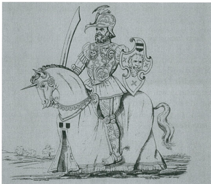
Hercules Leuven 1594

Daar waar de reuzen vroeger altijd werden gedragen voorziet men nu onderaan het onderstel wieltjes zodat de "draggers" de reuzen gewoon moeten voort duwen.