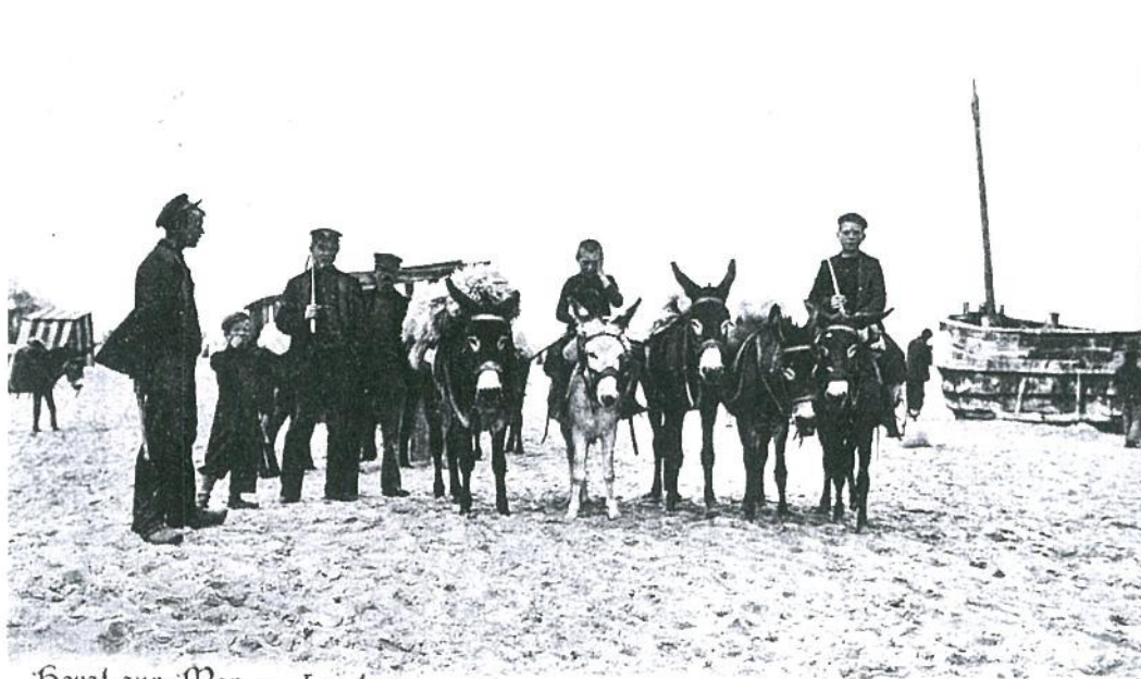
Heyst-sur-Mer. — Les Anes.