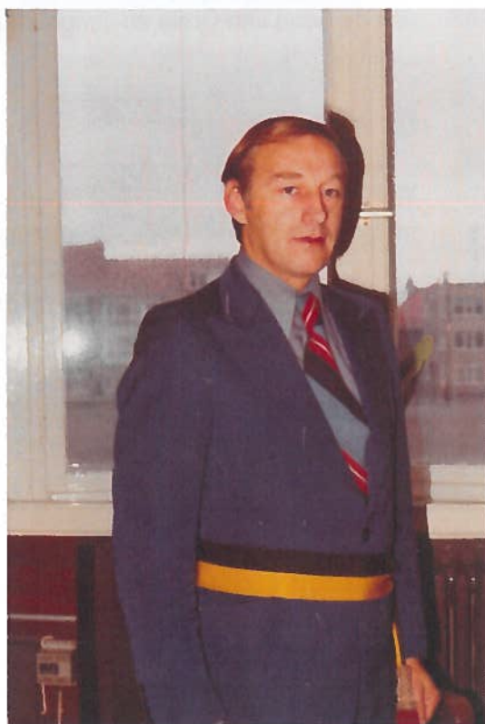
Een jonge schepen getooid met het ambtelijk lint

Ondertussen is Joseph niet meer politiek actief maar volgt hij nog wel het bestuur en blijft hij ook in contact met zijn vrienden uit het schepencollege en de gemeenteraad. Via zijn zoon Piet die schepen is blijft hij uiteraard ook nog betrokken.