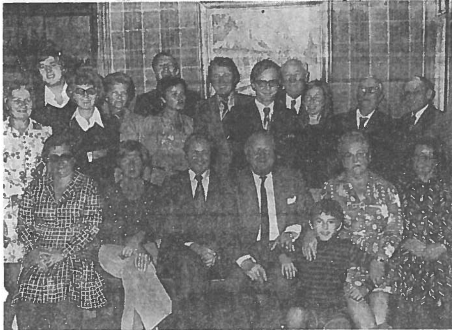
Dit zijn dan de eerste leden van de heemkundige kring van Heist. Zij hopen nu dat de belangstelling van de Heistenaars hen zal helpen tot een uitbouw die de moeite loont. (dh)