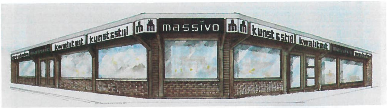
De gekende meubel- en decoratiezaak in de Knokkestraat 20 (nu Toerisme en Vishandel Depaepe)