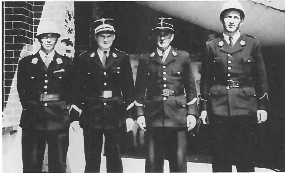
Politieploeg Duinbergen 1950