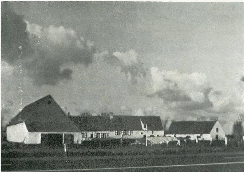
De Ste-Klarahofstede langs de baan Zeebrugge-Lissewege-Brugge