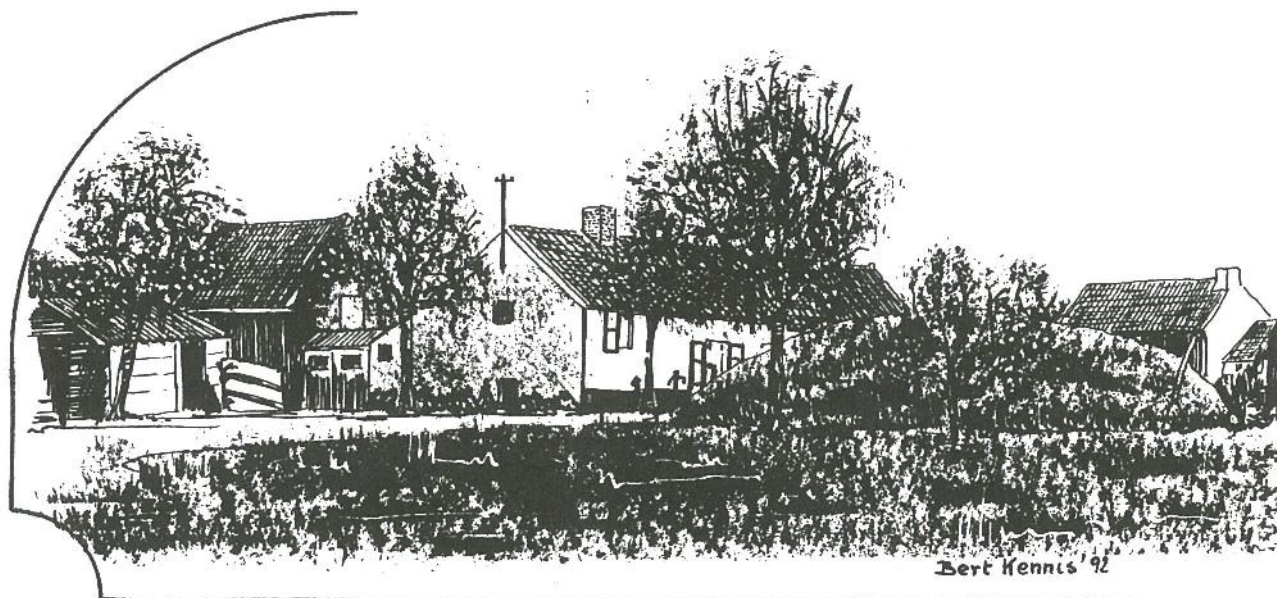
Hofstede „Pompoentje” toestand rond 1960.

Geiten kwamen zelden voor bij de boeren. De geit was immers de „koe” van de arme werkman. Maar eigenaardig genoeg, een boer die slechts één paard had, zette soms wel eens een geit in het sliet. Niet uit bijgeloof, maar omdat een paard niet graag alleen staat, want dan gaat het kribbijten. Wel bijgeloof was het dan om een geitebok tussen de zieke koeien te zetten. De stank verdreef de ziekte!