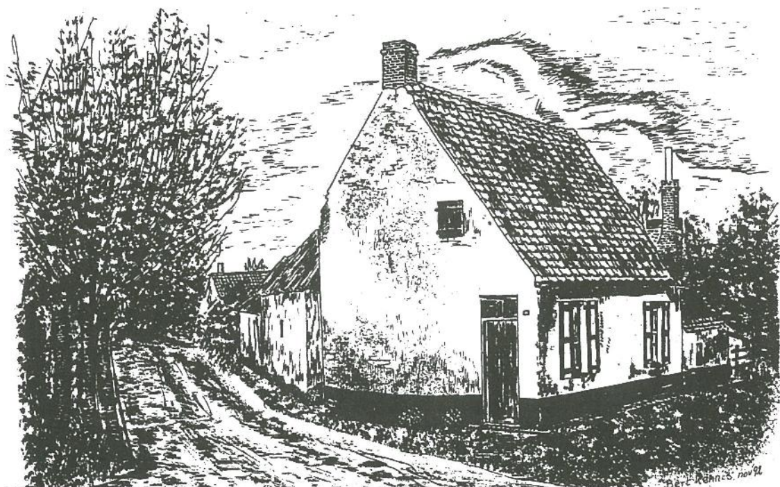
Herberg „DE MEUNIKKEREDE „ rond 1905.

Ik heb dus thuis en bij mijn grootouders toch wel één en ander vernomen over het boerderijgebeuren. Diverse artikels in „Rond de Poldertorens” (het tijdschrift van de Heemkundige Kring St.-Guthago) evenals mijn betrokkenheid bij het heemkundig museum „Sincfala” te Heist hebben mij eveneens nuttige informatie verstrekt.