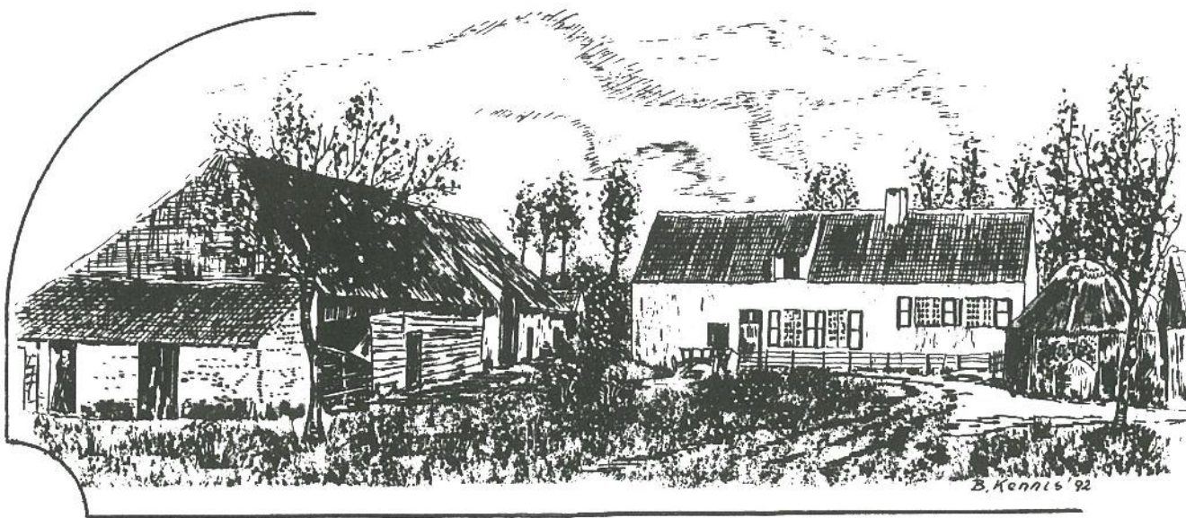
Hofstede van Standaert, rond 1900.

Het merendeel van de woningen van de hofsteden in het noorden behoren tot het langgeveltype.