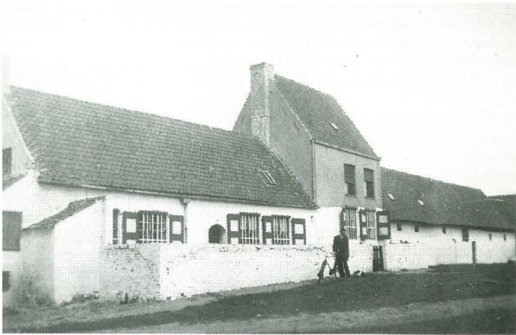
De hoeve Callant te Oostkerke