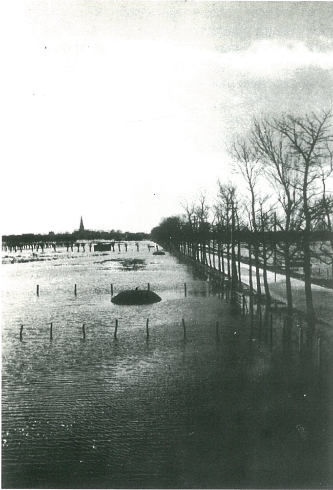
Sluisstraat richting Dorp. Boven het water uitstekend twee verdedigingsputten van de Duitsers.