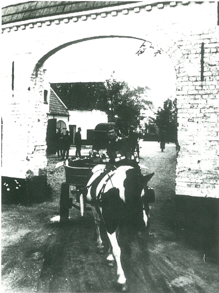
Het toen in Westkapelle goed gekende „Koepaardje” in de poort van het landhuis „Ter Kalvekete” (Kragendijk). Met dit paard en karretje reed bij de capitulatie de Duitse delegatie die met de Canadezen de modaliteiten van de overgave kwam bespreken.