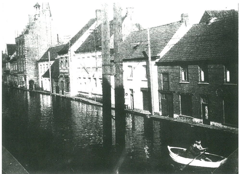
Dorpsstraat vanaf het huis van dokter Edmond Aernoudts tot het gemeentehuis.