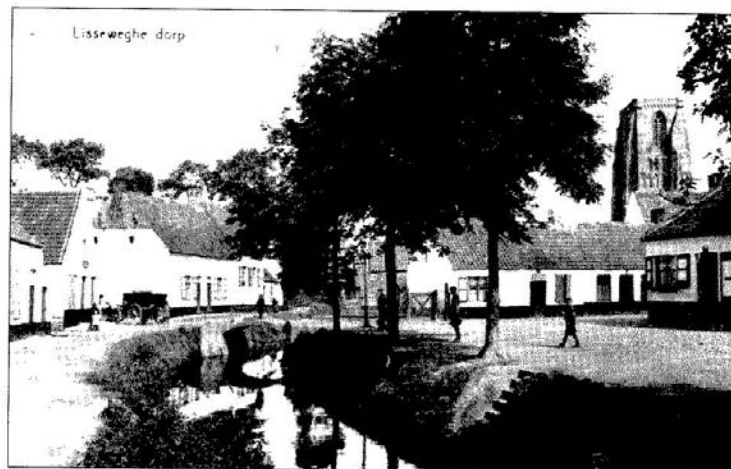
De Poermolen met het Beestenhol, in het gangetje links naast Café Den Brésil, toen ook 't Apertje, nu café St.- Amand, vulgo 't Duvekot