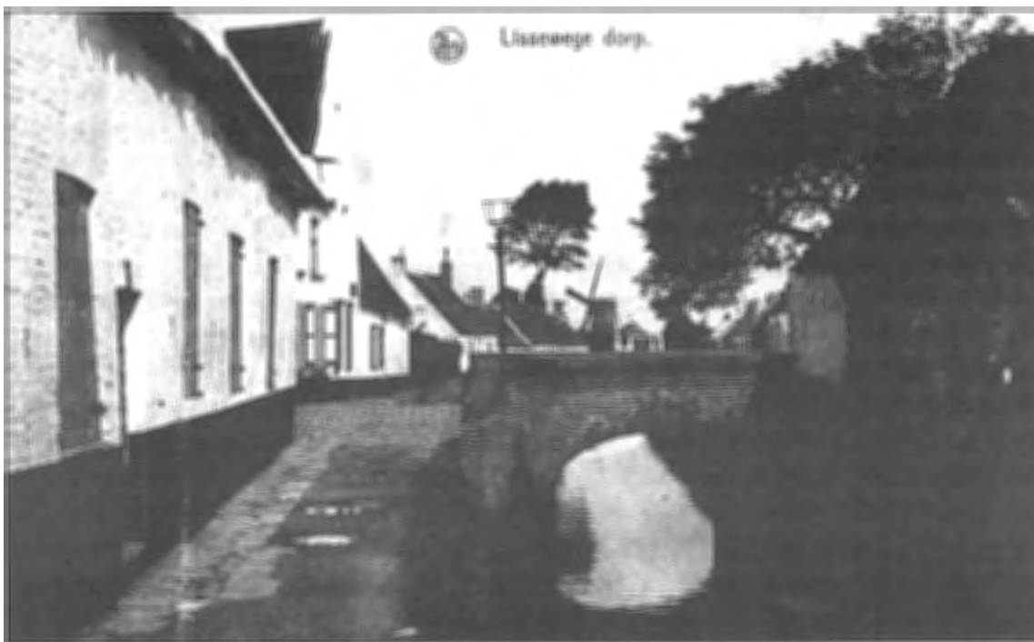
D 'Heule met Miel Smidtsmolen, waar vader en zoon een duik in het Reitje namen

gewoon een dunne houten scheidingswand. Zo hadden we drie plaatsen: een slaapkamer, een keukenwoonplaats en de winkel. In de winkel timmerde mijn vader zelfs een dis. 'Let wel! Die is maar provezoor,' zei mijn vader. Ce n'est que le provisoire qui dure. Die dis met zijn glazen plaat hield het vol tot 1948. Tot mijn moeder stierf.