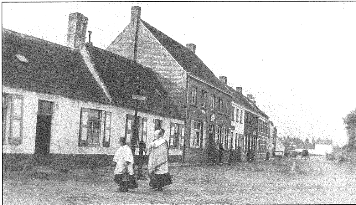
De Markt gezien in de richting van Brugge in 1920. De berechting is juist voorbij de herberg "De Oude Smisse" (nr 12)