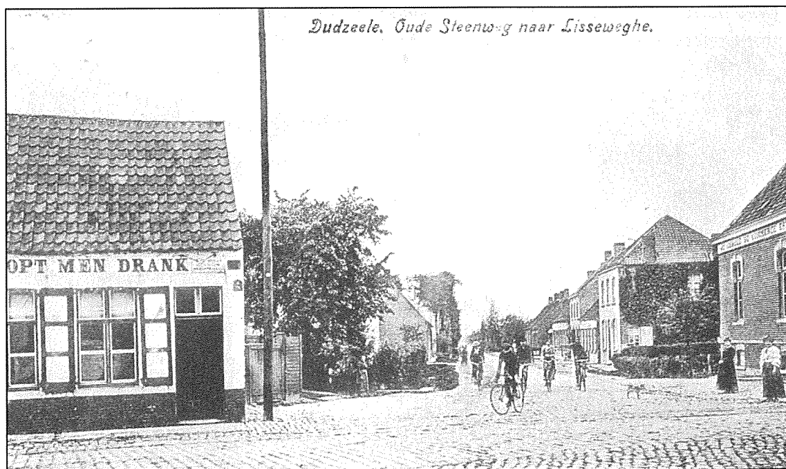
Dudzele, Oude Steenweg naar Lisseweghe.