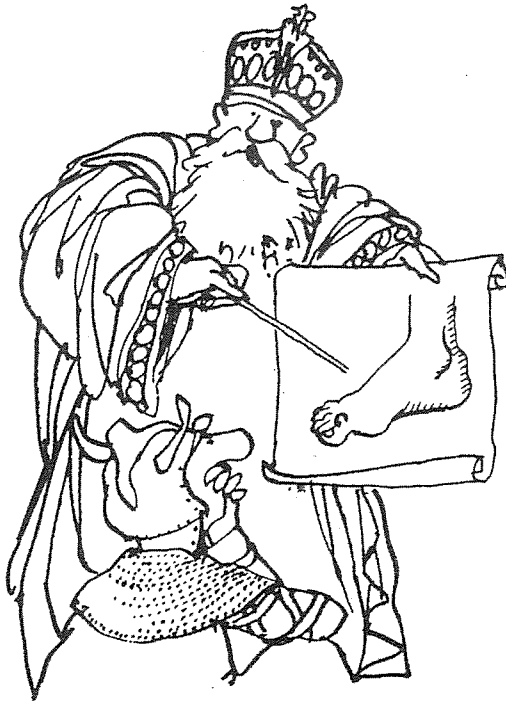
Charlemagne et Roland — la leçon de cor —

2. Karel de Grote.- Cor is zowel hoorn als eksteroog. Hier toont de keizer aan zijn paladijn hoe hij op de hoorn moet blazen in de Pas van Roncesvalles. Wist je dat het Franse Oostfrontlegioen naar Charlemagne was genoemd?