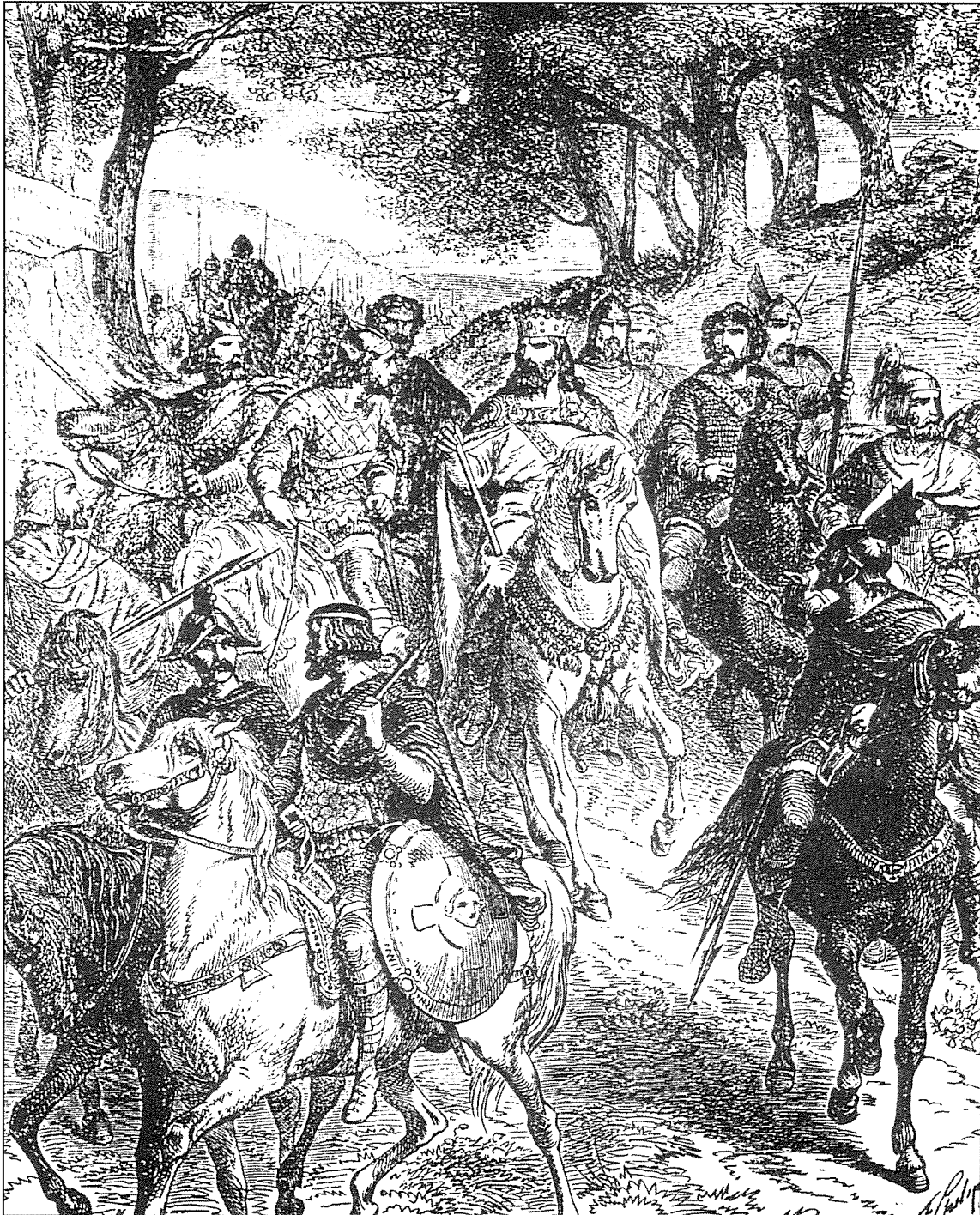
1. Karel de Grote .- Een echt portret van deze keizer hebben we niet. De leukste afbeelding vinden we is zijn voorstelling als hartenheer uit ons klassieke kaartspel.