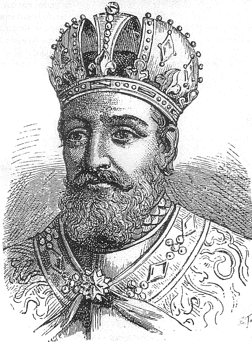
KAREL DE KALE, KONING VAN WEST-FRANKENRIJK.

Brugge. Vader erkent het huwelijk niet. Wie het wel erkent is Hroereker, stamhoofd van de Friezen die aan de overkant van het Zwin de baas is. Hij stelt voor een een verbond te sluiten tegen paus en koning. De paus geeft de koning de raad om van Bouden zijn leenman te maken. Geef hem de moerassen en schapenweiden rond Brugge en laat hem die verdedigen tegen de heidense Friezen. Eerste stap naar een onafhankelijk Vlaanderen?