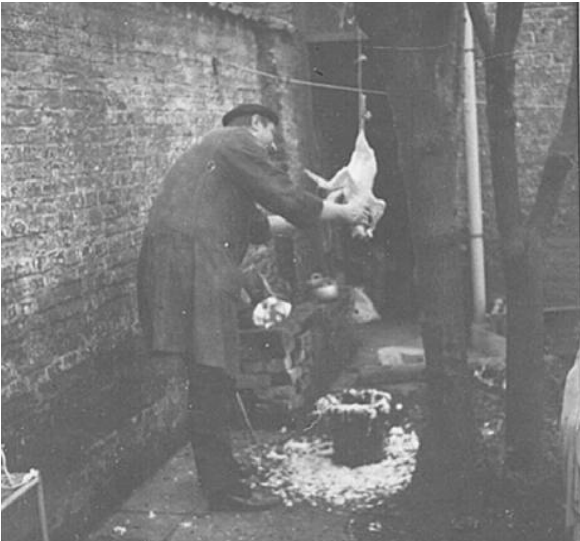
Ook een pastoor moet eten

terug ontdekken. “Zingende buizerd” (zijn totemnaam), het scoutspetje, de warme vriendschap, zijn blijvende herinneringen.