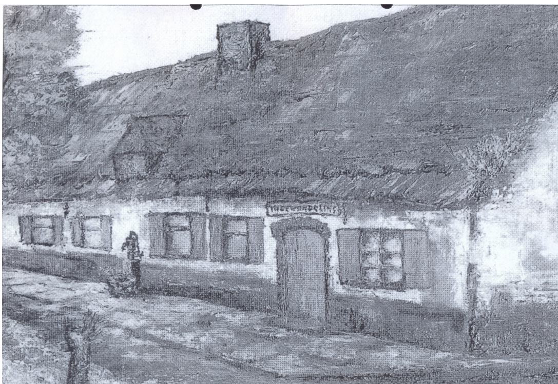
Café De Wandeling-Vuilpot

DELANGE B., DUCATTEUW E., De herbergen in Desselgem door de eeuwen heen, een tijdschroniek (deel 2), in De Gaverstreke. Jaarboek van de Geschied- en Heemkundige Kring , 34, 2006, pp. 139-142.