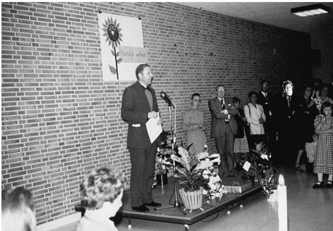
Medepastoor te Heist

bewaarheid: het aantal ouderen is schrikbarend hoog, van de hoogste in Vlaanderen.