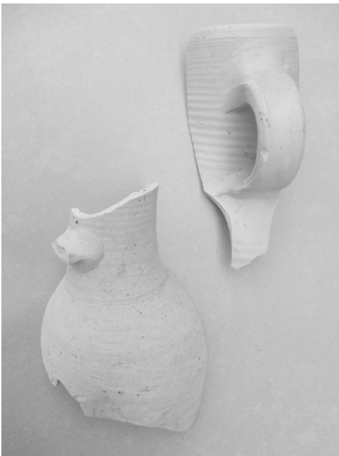
Afb. 4: Halsfragment met oor en een schouderfragment van Jacobakannen