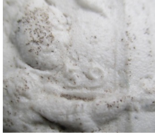
Afb. 3: Detailbeeld met het cijfer "39". Verwijzing naar hoofdstuk 39.