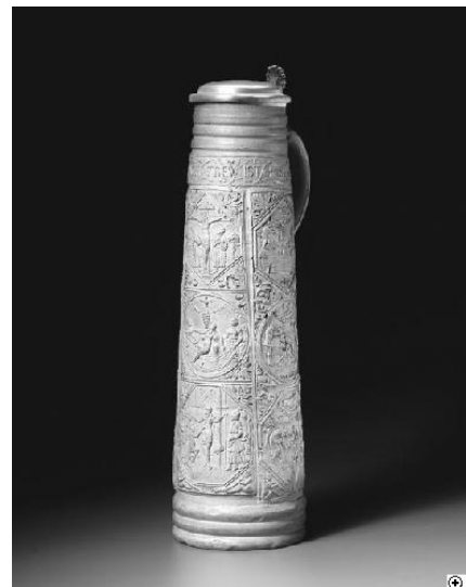
Afb. 5; Zo ziet een "SCHNELLE" er uit. Dit exemplaar pronkt in het Kestner-Museum in Hannover.