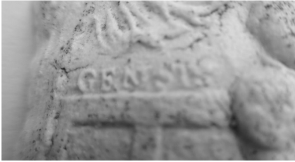
Afb. 2: Detailbeeld met "GENESIS", de verkorting van Genesis.