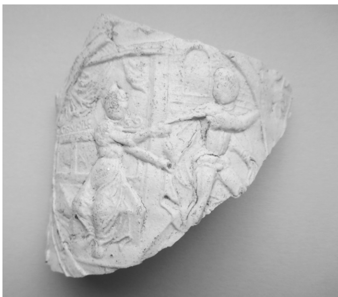
Afb. 1: De scherf met afbeelding van de wegvluchtende Jozef.

Na reiniging had ik een bleek tot wit hard gebakken scherf met een bijna volledig tafereel in een medaillon op (afb. 1). Het breukvlak toont de opbouw van de pot in twee afzonderlijke lagen aan. Op een draaischijf werd eerst de pot gevormd. Aan de binnenkant zijn hierdoor de draairibbels duidelijk zichtbaar. De figuratieve laag werd eerst gemaakt op een negatieve vorm waarin de afbeelding uitgesneden was. Deze lap klei werd dan op de reeds gevormde pot aangebracht waarna het geheel in een bedstede. Met beide handen trekt ze aan de mantel van een man. Links