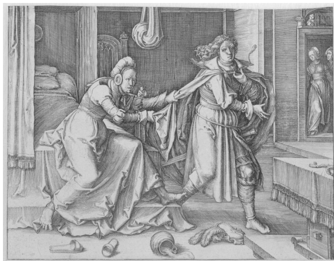
Afb 7: Jozef en de vrouw van Potifar, prachtig afgebeeld op een houtsnede in het Alma Boijmans van Beun museum in Rotterdam.