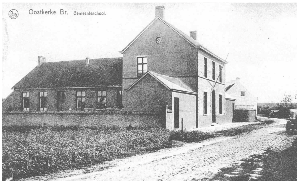
De gemeenteschool van Oostkerke, gebouwd in 1868 in traditionele stijl.