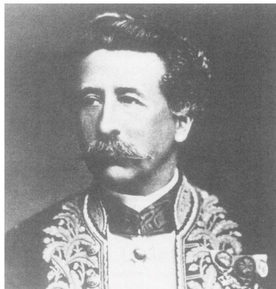
Theodore Heyvaert (Gistel 1834 – St.-Pieters-Woluwe 1907), Gouverneur van de provincie West-Vlaanderen van 1878 tot 1883. Als fanatiek radicaal liberaal maakte hij zich tijdens de schoolstrijd bijzonder hatelijk bij de katholieken.