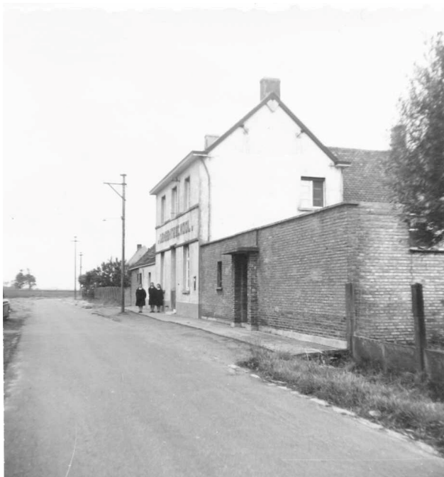
De Hoekse gemeenteraad vertrouwde na de schoolstrijd de openbare gemeenteschool toe aan de Zusters van de H.Kindsheid uit Ardoeie, wat heel uitzonderlijk was.