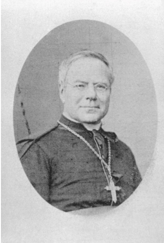
Joannes-Josephus Faict (Leffinge 1813 – Brugge 1894), bisschop van Brugge vanaf 1864 tot aan zijn dood. Zijn episcopaat werd gekenmerkt door behoudsgezindheid en strijdbaarheid. Dat kwam vooral tot uiting tijdens de schoolstrijd van 1879 tot 1884.

1894). Zijn grote tegenstander was de West-Vlaamse gouverneur Theodore Heyvaert (1878-1883). Meer nog dan in de steden, vierden in de Vlaamse dorpen het fanatisme en de onverdraagzaamheid hoogtij. In onze polderdorpen ging het niet anders.