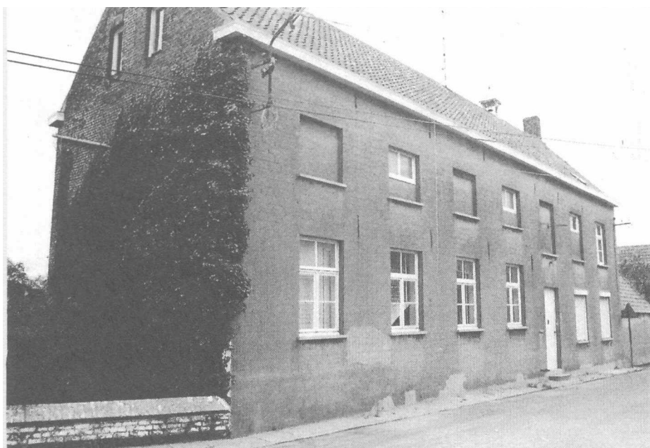
In dit landelijke kloosterschooltje nabij de kerk van Koolkerke, gaven de Zusters Maricolen uit Brugge al sinds 1855 les aan de meisjes uit het dorp.