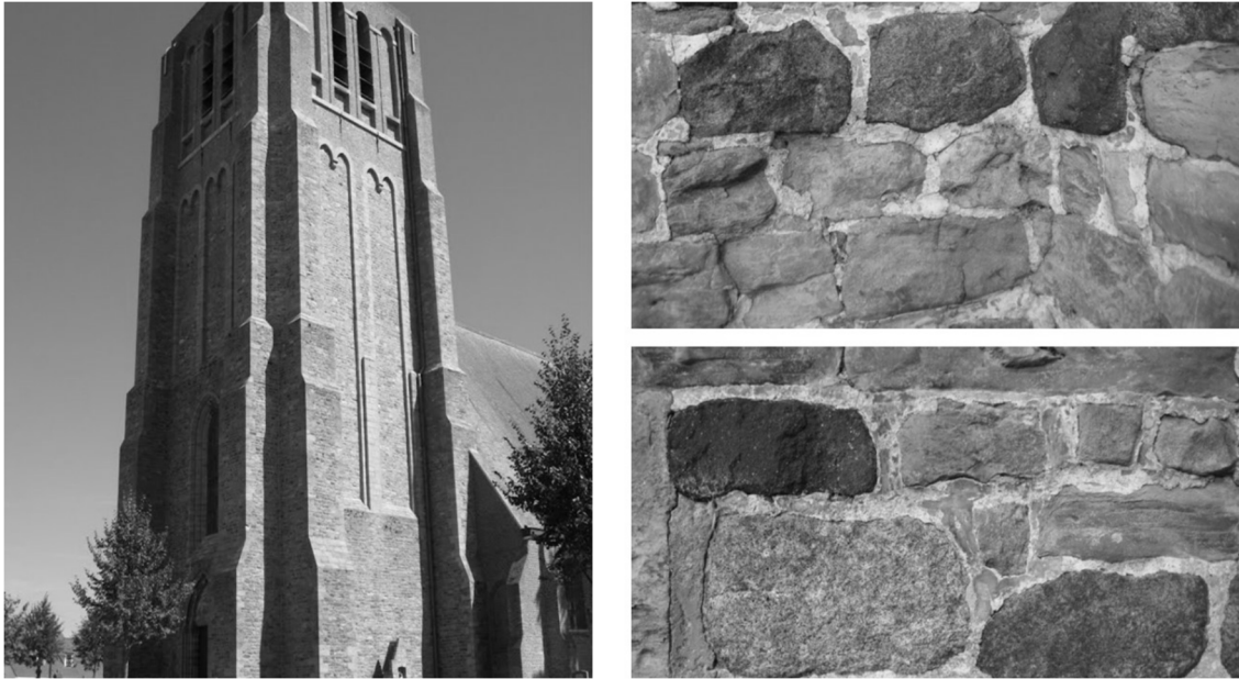
Figuur 1: Opvallend gekleurde hergebruikte ballaststenen (granieten en amfibolieten) in de Sint-Guthago kerk in Oostkerke (Damme)

De studie wijst erop hoe, vertrekkende van tot op heden onontdekte en op het eerste gezicht ordinaire objecten, een boeiend verhaal kan geschetst worden over middeleeuwse handelsmechanismen in Europa. Het duidt ook op het grote belang dat het unieke systeem van de verdwenen en vergeten Brugse voorhavens langs het Zwin in die handel bekleedden.