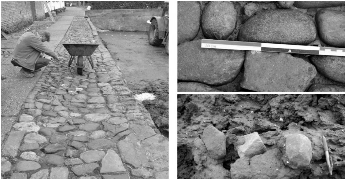
Figuur 2: De ballaststenen werden vooral teruggevonden in Hoeke, zowel ingewerkt in paadjes als bovengeploegd op de akker.