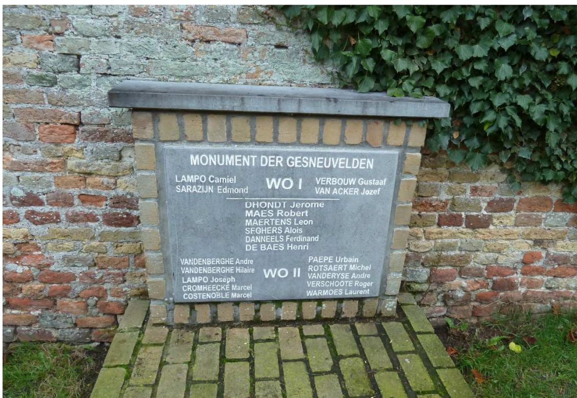
Figuur 12. Gedenkplaat voor de militaire slachtoffers te Damme, Kerkstraat

In de Kerkstraat in Damme bevindt zich een gedenkplaat voor de gesneuvelden uit de beide Wereldoorlogen (figuur 12). Deze plaat is tegen de tuinmuur achter de Onze-Lieve-Vrouwekerk geplaatst. Het betreft een rechthoekige granieten plaat steunend op twee kleine kraagstenen, met als opschrift " Monument der gesneuvelden ". Onder de namen van de slachtoffers uit de Grote Oorlog staan deze uit de Tweede Wereldoorlog. De gedenkplaat werd onthuld op 21 juli 1986 85