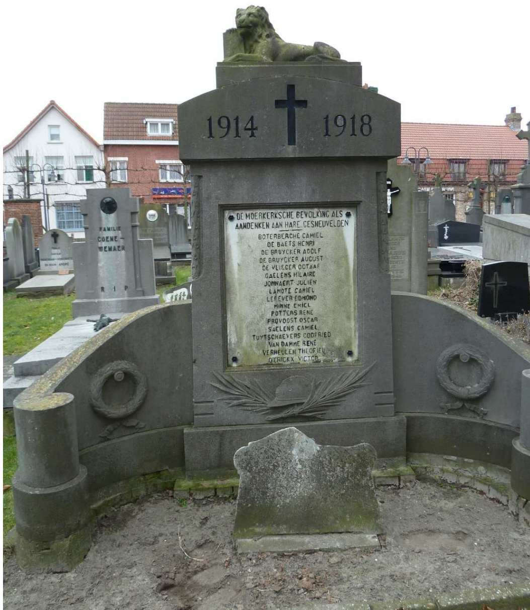
Figuur 22. Gedenksteen voor de militaire slachtoffers uit WO I in Moerkerke, Kasteelstraat

In Moerkerke bevindt zich een gedenksteen voor de militaire slachtoffers uit WO I op het kerkhof, links naast de toegangsweg tot de Sint-Dionysiuskerk, in de Kasteelstraat (figuur 22).