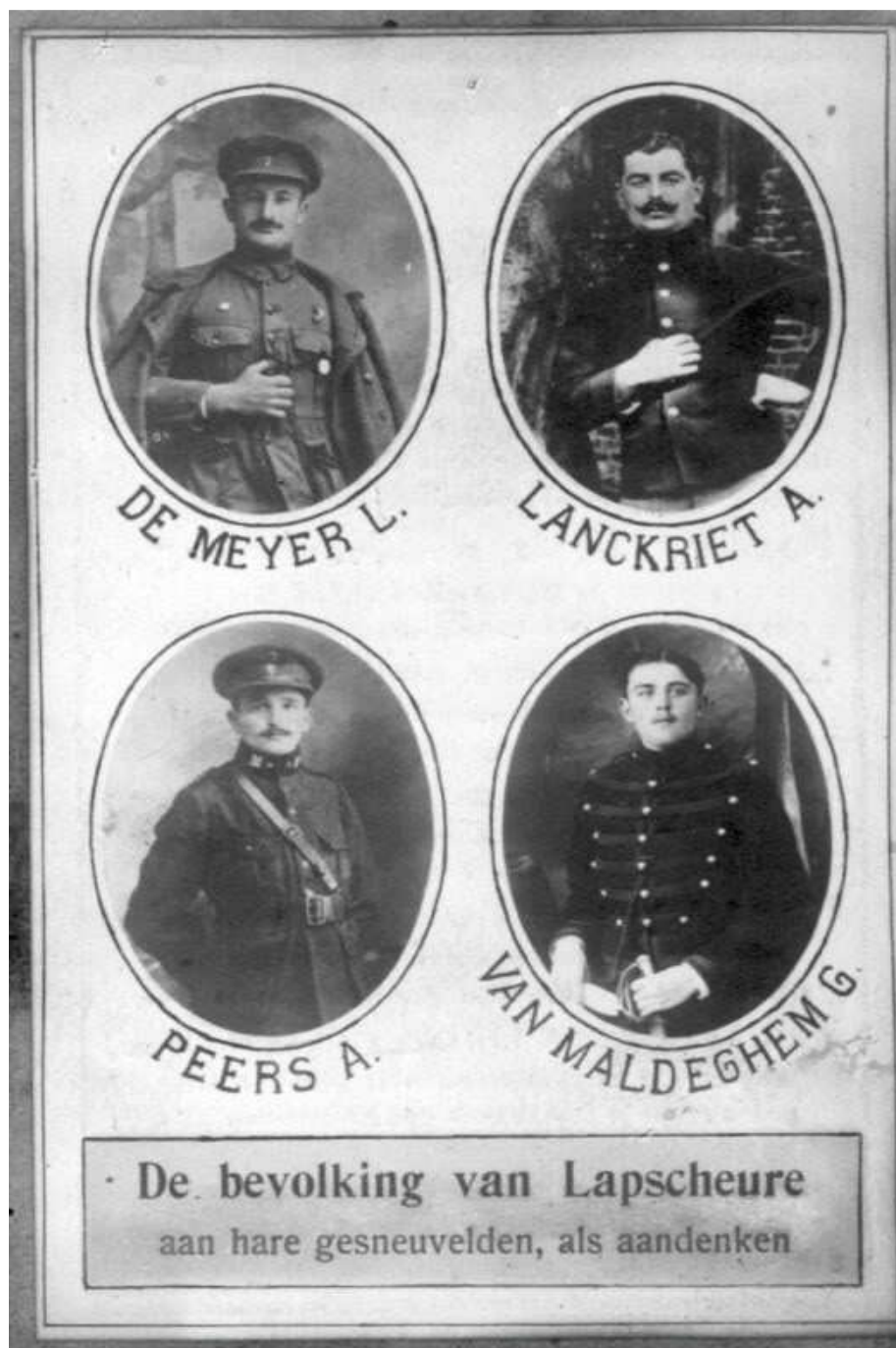
Figuur 20. Oorlogsslachtoffers Lapscheure 101

Tien mannelijke inwoners van Lapscheure, geboren in 1893, werden ingeschreven in de militieregisters 102 van 1912, voor de lichte 1913. Zes werden aangewezen om dienst te doen in verschillende eenheden. Drie werden definitief vrijgesteld (broederdienst). Eén werd vrijgesteld voor een jaar.