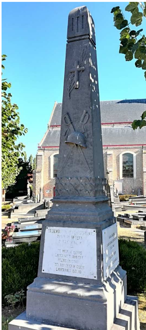
Figuur 19. Gedenkzuil voor de militaire slachtoffers uit WO I in Lapscheure, hoek Hoogstraat – Lapscheurestraat, aan de ingang van het kerkhof

Het monument werd geplaatst in opdracht van de gemeente en uitgevoerd door H. Rousseau uit Brugge. Op 24 mei 1920 werd het onthuld 100 .