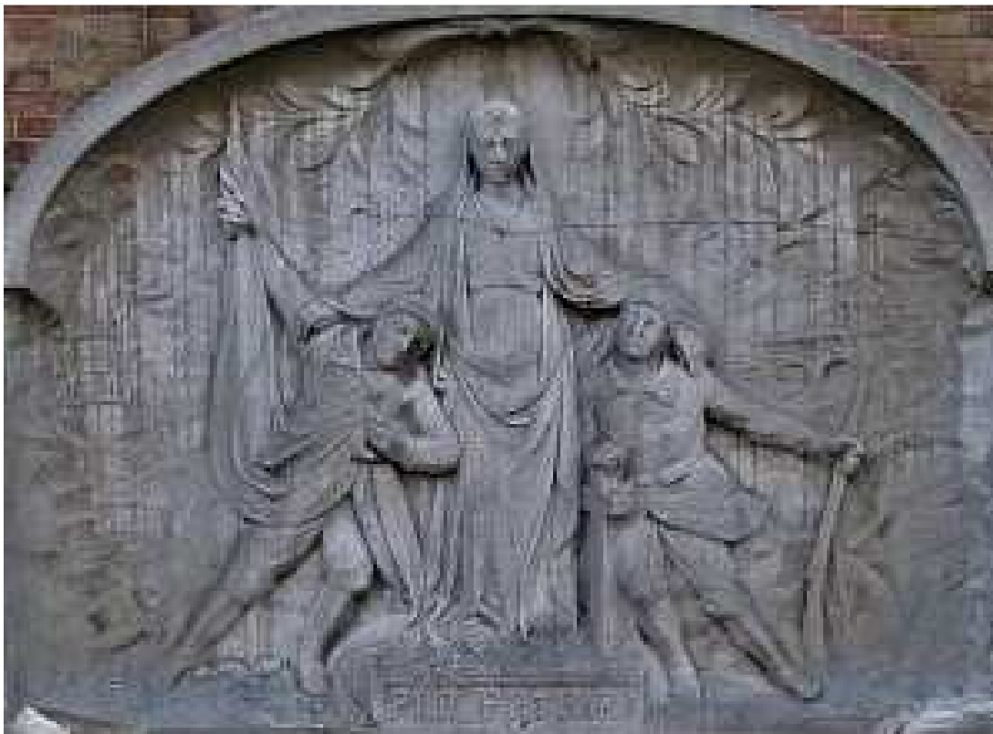
Figuur 50. Gedenksteen voor de militaire en de burgerlijke slachtoffers van Wereldoorlog I, Dorpsstraat, Westkapelle; detail van de reliëfvoorstelling

De voorstelling in het reliëf (figuur 50) stelt Maria voor die in het midden zit en een ster draagt op het hoofd. Zij legt een beschermende hand op het hoofd van twee soldaten links en rechts van haar. De ene soldaat houdt een vlag in de hand, de andere draagt zijn geweer en steunt op een kruis. Op de achtergrond wordt de vernieling van een stad gesuggereerd met bliksems, vlammen en steenhopen. Boven het hoofd van Maria is loofwerk gesculpteerd. Onderaan het reliëf staat de tekst: " Pro Patria ". Op het linkerdeel van het monument: " Westcappelle aan zijne helden ", ernaast het wapenschild van West-Vlaanderen en eronder een deel van de namen van de gesneuvelden en van de burgers. Op het rechterdeel staat het wapenschild van België en het andere deel van de namen. Alle namen zijn chronologisch gerangschikt 188 .