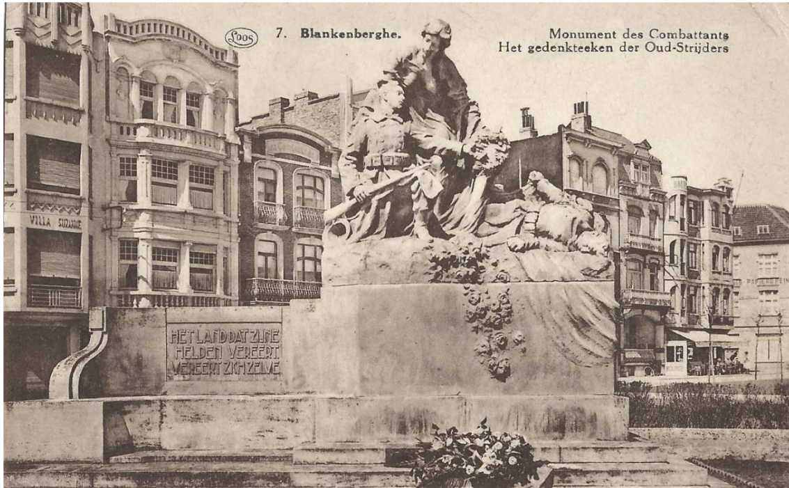
Figuur 52. Standbeeld voor de militaire slachtoffers uit W.O. I, dat zich vroeger op de Grote Markt te Blankenberghe bevond en in 1987 werd verwijderd

Het monument werd uitgevoerd door Simon Goossens en Alfons De Cuyper. De kostprijs bedroeg 22.000 fr. en op 27 maart 1921 werd het plechtig onthuld 196 .