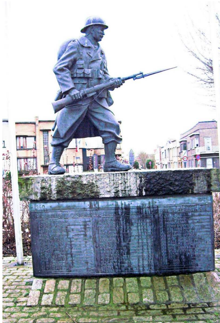
Figuur 53. Oorlogsmonument op het De Langheplein, Blankenberge

Het gedenkteken werd in 1987 verwijderd bij de heraanleg van de Grote Markt en in november 1987 werd er een nieuw monument ter ere van de strijders van de beide Wereldoorlogen geplaatst op het De Langheplein (figuur 53).