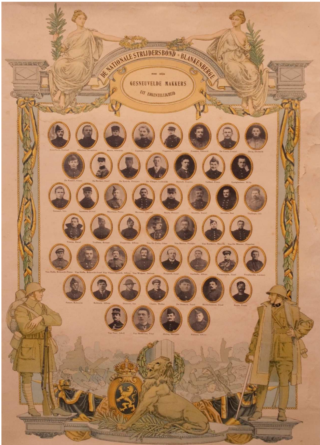
Figuur 56. Affiche met zwart-wit foto's van de 49 overleden militairen uit Blankenberge