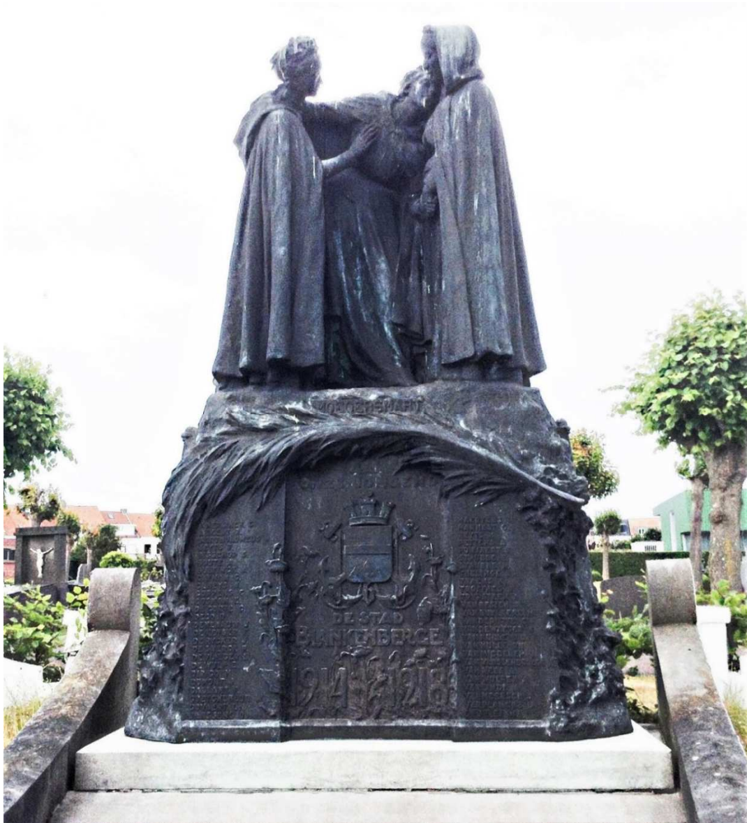
Figuur 54. Standbeeld voor de militaire slachtoffers, genaamd "Moedersmart", Scharebrugstraat, Blankenberge, Belgisch militair erepark op de Stedelijke begraafplaats. - © De Moor Marina

Een tweede monument staat op de centrale begraafplaats van Blankenberge aan de Scharebrugstraat. Achterin op deze begraafplaats bevindt zich een cirkelvormige, omhaagde soldatenbegraafplaats met een beeldhouwwerk genaamd "Moedersmart" (figuur 54).